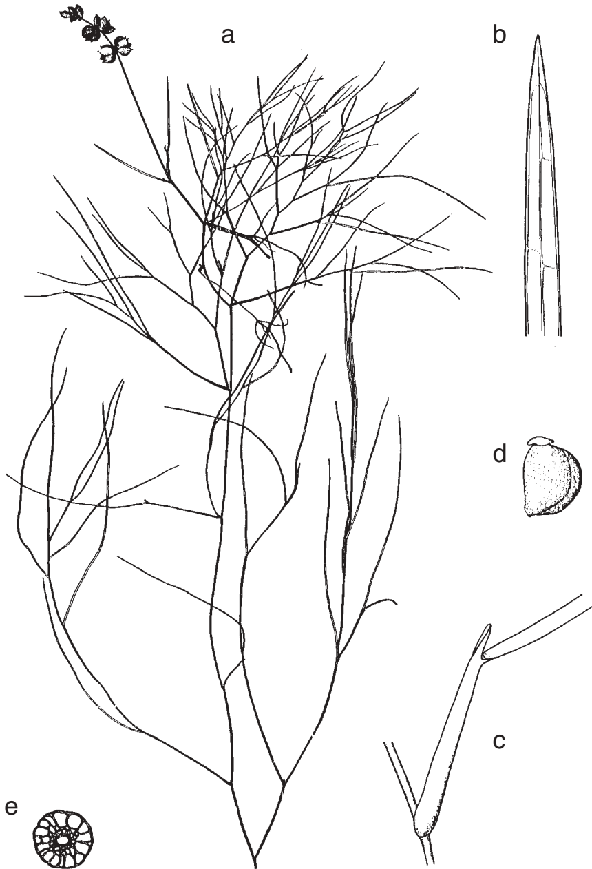
Obr. 1. – Potamogeton pectinatus : a – habitus; b – detail žilnatiny v horní části listu; c – palisty z větší části rostlé s bází listu, tvořící tak listovou pochvu; d – plod; e – příčný průřez horní částí lodyhy. (a, d, e – převzato z práce Mađalski 1977; publikováno se souhlasem nakladatelství Wydawnictwo Naukowe PWN, Varšava; b, c – nakreslil Z. Kaplan).

Fig. 1. – Potamogeton pectinatus : a – general habit; b – detail of venation in upper part of leaf; c – stipules adnate for most of their length to the leaf base (stipular sheath); d – fruit; e – cross-section of upper part of stem. (a, d, e – after Mađalski 1977; published with permission from Wydawnictwo Naukowe PWN, Warszawa; b, c – drawn by Z. Kaplan).