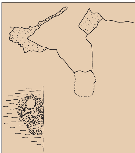
V horní části obrázku typový náčrt doupěte dospělé samice slídáka X. nemoralis , ve spodní části pobled na noru shora. Orig. V. Smola

Důležitým momentem bylo oboustranné bušení předníma nohama o podklad, které vedlo k postupnému přibližování a závěrem k charakteristickému prolínání koncových článků předních nohou. Po tomto jevu již samec mohl bez problémů vystoupit zepředu na hřbet samice a postupně vsunout pravý a poté i levý embolus (vývod kopulačního orgánu na konci makadla) do příslušných samičích kopulačních otvorů na břišní straně zadečku. Potom samec