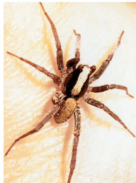
Slíďák Xerolycosa nemoralis

O hrabací činnosti tohoto druhu nebylo dosud známo nic. A. Nosek v r. 1904 ve své knize píše: „Jiné druhy ( Xerolycosa nemoralis a rod Pardosa ) nemají žádného úkrytu.“ Dokonce i rakouští arachnologové K. Zehethofer a Ch. Sturmbauer (1998) zabývající se fylogenetickými vztahy vybraných středoevropských druhů čeledi slíďákovitých (na bázi ribozomální sekvence 12S) došli ke stejnému závěru. Přímo uvádějí: „Vypadá to, že se vagrantní chování (druh běhá volně po povrchu půdy) vyvinulo dvakrát nezávisle na sobě, nejprve u rodu Xerolycosa , později u rodu Pardosa .“ Tím dávají jednoznačně najevo, že slíďák X. nemoralis je klasickým druhem volně žijícím na svrchní vrstvě epigeonu. Dále v článku se však veskrze podivují nad tím, jak je možné, aby byl druh podle sekvence DNA vývojově původnější a přesto měl vyvinuto vagrantní chování, které je chováním odvozenějším, tedy později vzniklým. Rod Xerolycosa je totiž podle výše uvedených autorů mnohem původnější než rody Arctosa , Alopecosa a Trochosa , které si nory hrabou. Teprve nejodvozenější rod slíďáků Pardosa nikoli. Slíďáci jsou zřejmě jedinou z čeledi vyšších pavouků (podřád Aranemorphae ), jejíž