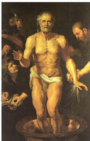
P. P. Rubens: Senecae mors (1615)

mortis decus māvīs: nōn invidēbō exemplō. Sit huius tam fortis exitūs cōstantia penes utrōsque pār, clāritūdinis plūs in tuō fine ". Post quae eōdem ictū braccia ferrō exsolvunt. Seneca, quoniam senīle corpus et parcō vīctū tenuātum lenta effugia sanguinī praebēbat, crūrum quoque et poplitem vēnās abrumpit; saevīsque cruciātibus dēfessus, nē dolore suō animum uxōris infringeret atque ipse vīsēdō eius tormenta ad impatientiam dēlāberētur, suādet in aliud cubiculum abscēdere. Et novissimō quōque mōmentō, suppeditante ēloquentiā, advocātīs scrīptōribus plēraque trādidiit, quae in vulgus ēdita eius verbīs invertere supersedeō.