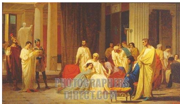
F. A. Bronnikov: Thraseae datur mortis arbitrium (1873)