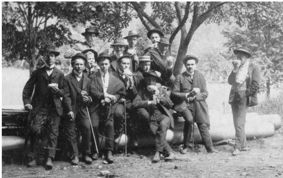
Předmaturitní výlet do Orlických hor. Sedím zcela vpředu s květinami.