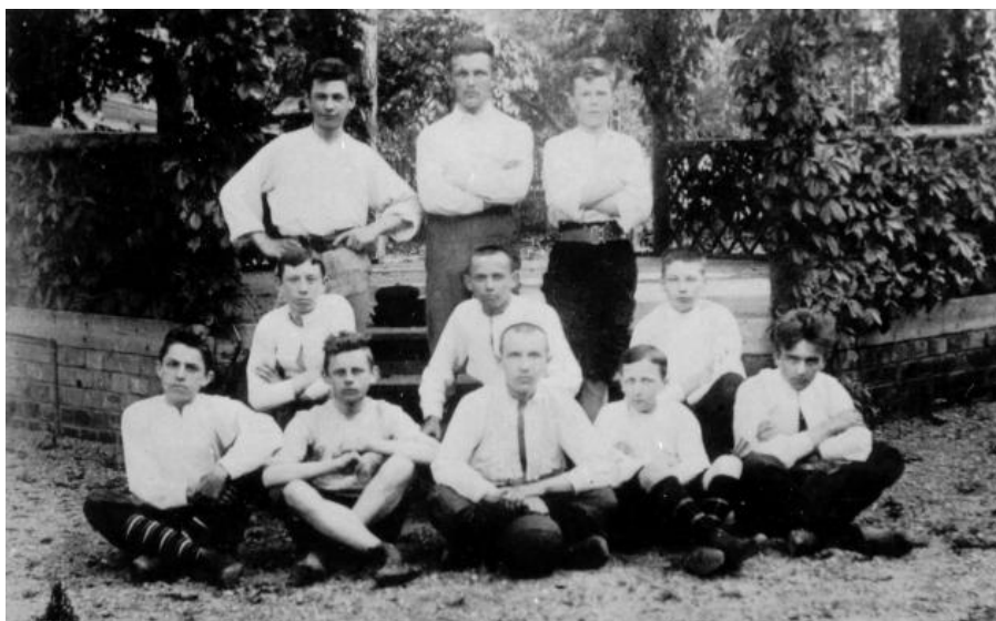
Fotografie fotbalového družstva „Nazdar“ z roku 1902. V dolní řadě vlevo je obávaný střelec gólů B. Š.

Ve škole nás učili většinou piaristi. Byli to výborní učitelé, kteří k nám byli laskaví. Často používali krátké latinské věty jako například „bene, bene, amice“, na které jsme si brzy zvykli a porozuměli jim. Profesor přírodopisu šňupal tabák i při vyučování a nosil v šose kabátu červený kapesník, který mu neustále vykukoval. Jednou, když procházel mezi lavicemi, jsem se mu ho pokusil vytáhnout, ale milý pan profesor mne při tomto činu chytil za ruku. Hned jsem musel k tabuli a popsat kočkodana bezocasého zvaného „micetae seniculum“. Byla to stará látka a já jsem poprvé u tabule plaval a vysloužil si oslovení „prázdna nádoba“. Na pololetním vysvědčení mi dal čtyřku, ale později i on mne měl rád.