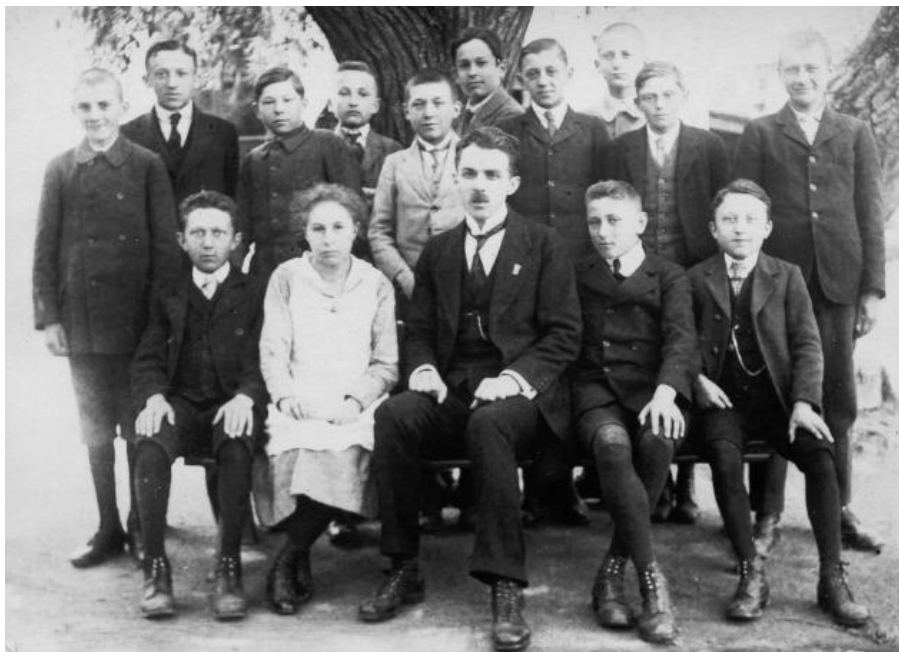
Třídní kvartánů ve Zlatých Moravcích.