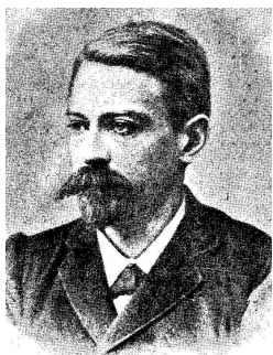
Thomas Joannes Stieltjes