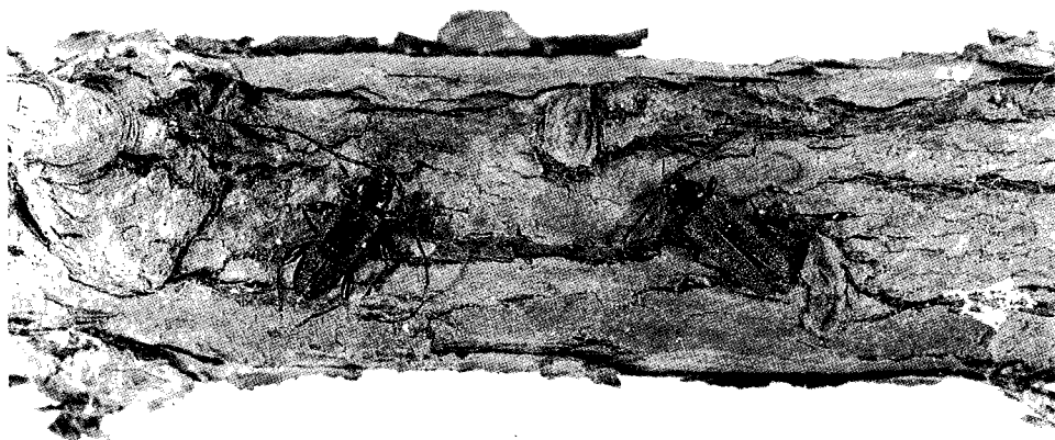
Fig. 2 - Adulti di C. rufipenne : a sinistra ♂, a destra ♀. (Foto di P. Bacciglieri).

L'insetto è stato rinvenuto, fino ad allora, solo su piante morte di Juniperus communis . Non è però da escludere che in futuro possa attaccare anche esemplari viventi o semplicemente indeboliti e risultare così dannoso.