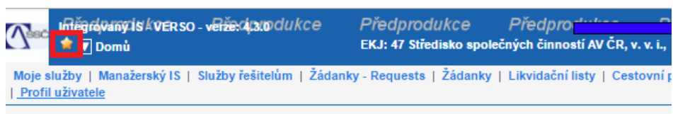
Obrázek 3 – Umístění ikony „hvězdičky“ pro zobrazení oblíbených sestav