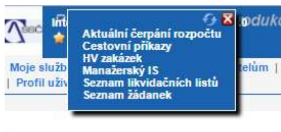
Obrázek 4 – Zobrazení oblíbených nabídek po kliknutí na ikonu hvězdičky

Po zvolení nabídky ze seznamu se uživateli otevře nové okno s vybranou nabídkou. Při přidávání a odebrání oblíbených nabídek doporučujeme aktualizovat menu hvězdičky za pomoci dvou šipek umístěných vedle křížku. Pokud uživatel ztratí právo na nabídku, kterou má nastavenou jako oblíbenou, změna nabídek se projeví až po kliknutí na nastavení portletu (viz obrázek 1).