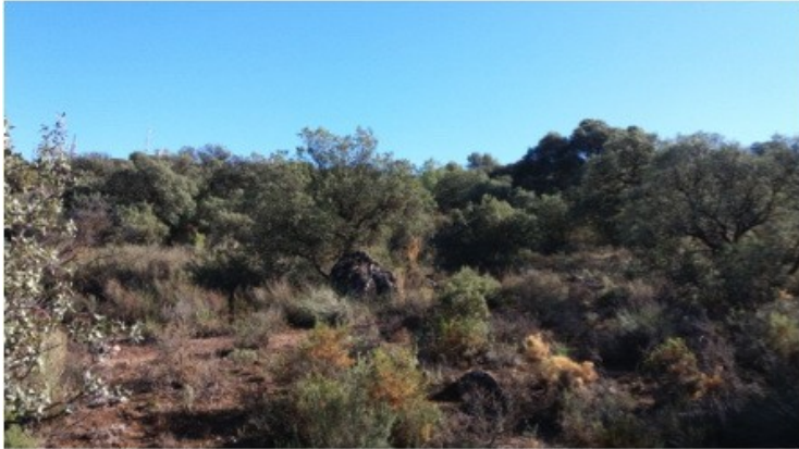
Fig. 2. Biotopo de sierra Elvira, Granada donde se localizó a Trichoferus magnanii Sama, 1992