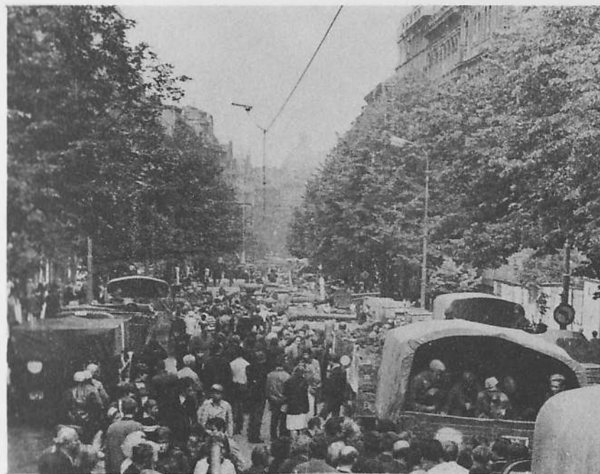
Obsazování Vinohradské třídy