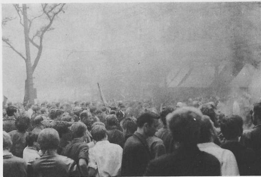
Pražané ráno 21.8.1968 před budovou rozhlasu