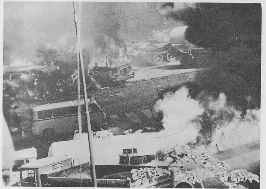
Hořící barikády u rozhlasu