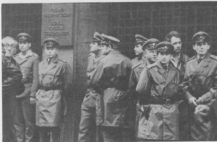
Střežení budovy čs. rozhlasu na Vinohradské třídě příslušníky VB před obsazením