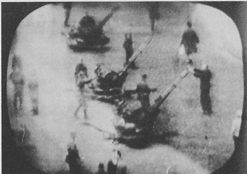
Čs. televize - snímky z obrazovky