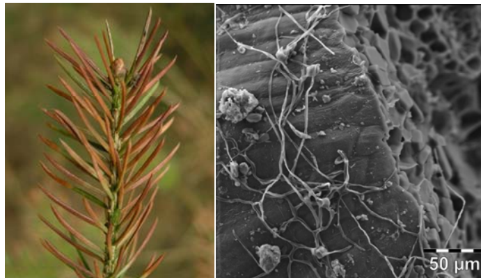
Chlorotic changes in needles cause by TCA

Trichloroacetic acid (TCA), used for decades as herbicide, was considered because of its phytotoxic properties as one of important stressors in the field of studies of forest damages. Its content in needles was attributed to atmospheric photooxidation of C 2 -hydrocarbons produced and used in large quantities as industrial solvents. Using radiotracer techniques and [1,2- 14 C]TCA uptake, translocation