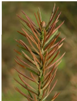
Chlorotické změny v jehličí způsobené TCA

Kyselina trichloroctová (TCA), používaná desetiletí jako herbicid, byla pro své fyto toxické vlastnosti v oblasti studia poškození lesa považována za jeden z významných stresorů. Její obsah