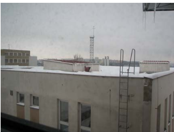
Obr. 7b – vyřešení klempířských prvků na střeše