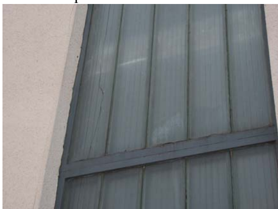
Obr. 2 - kopility