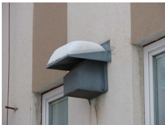
Obr. 5 – ventilátory k demontáži (3x)