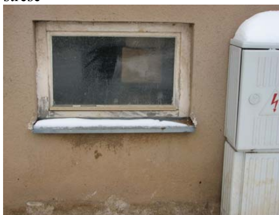
Obr. 8 – sklepní okna - výměna