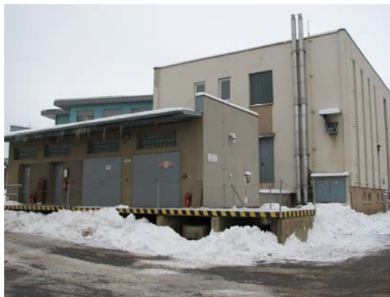
Obr. 10 – sklad tech. plynů - vpředu