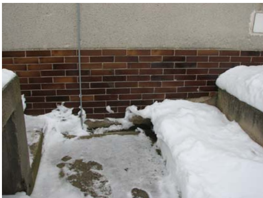
Obr. 9 – obložení kabřincem – oprava (u země)