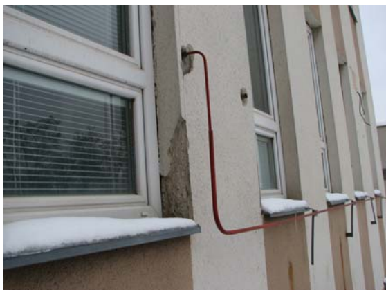
Obr. 1a – opadaná omítka