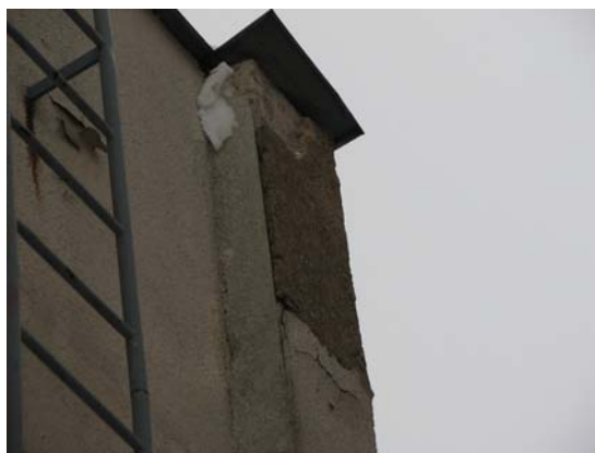
Obr. 7a – vyřešení klempířských prvků na střeše