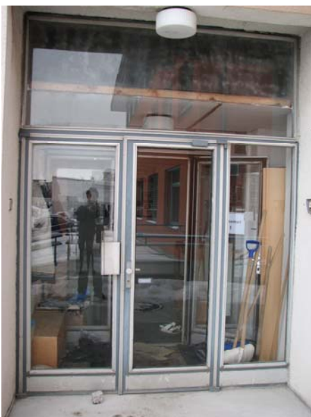
Obr. 4 - vstup