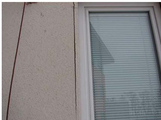
Obr. 1a – „odfouknutá“ omítka (u okna)