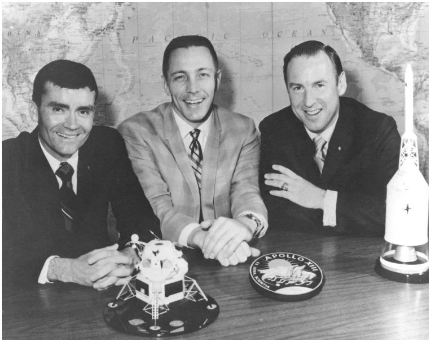
Posádka Apolla 13, zleva: Fred Haise, John Swigert a James Lovell.

Start nosné rakety Saturn 5 s lodí Apollo 13 proběhl 11. dubna 1970 v 19:13 světového času (dále UT) bez potíží. Jedinou neplánovanou událostí bylo předčasné vypojení prostředního motoru druhého stupně rakety. Celkově nižší výkon nosiče byl tedy vykompenzován dvaceti sekundami činnosti třetího stupně navíc. Po rutinní inspekci přístrojů astronauté restartovali motor třetího stupně nosné rakety a vyrazili k Měsíci. Všechno šlo bezvadně.