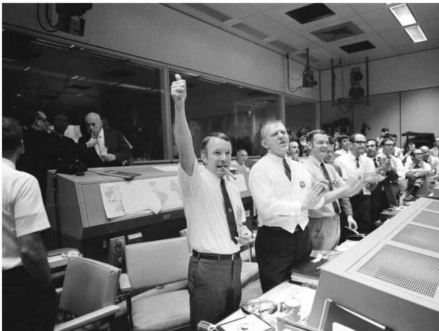
Oslavy bezpečného návratu v řídicím středisku.

Nedlouho poté vstupuje velitelský modul rychlostí 11 km/s do zemské atmosféry. Po krátkém, ale dramatickém přerušení spojení přichází konečně okamžik rozevření padáků a bezpečného přistání ve vlnách Tichého oceánu . Je 17. dubna 1970, 18:07 UT. Řídicím střediskem v Houstonu zní mohutný aplaus.