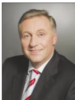
Ing. Mirek Topolánek, předseda vlády České republiky a předseda Rady pro výzkum a vývoj

Účastníkům ankety jsme položili otázku: „Jaká jsou dle vašeho názoru hlavní úskalí nebo problémy stávajícího systému rozdělování prostředků státního rozpočtu určených na podporu výzkumu a vývoje?“