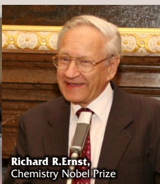
Richard R. Ernst , Chemistry Nobel Prize