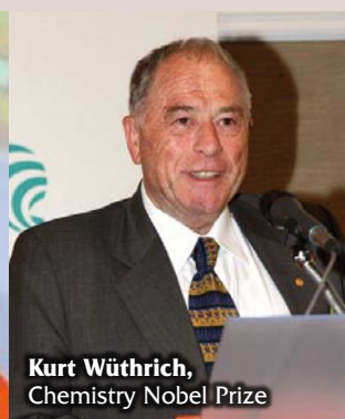
Kurt Wüthrich , Chemistry Nobel Prize