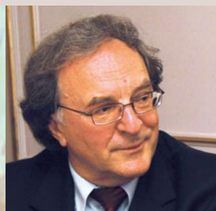
Timothy Hunt Medicine Nobel Prize