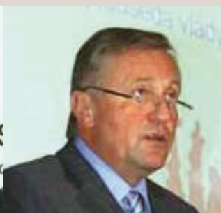
Mirek Topolánek, Czech Republic Prime Minister