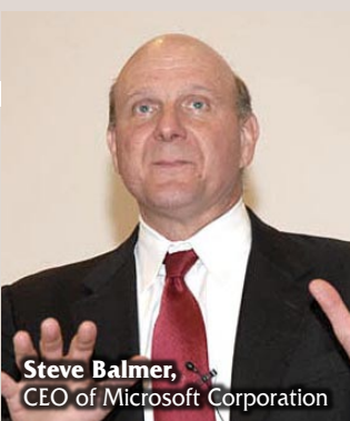
Steve Balmer , CEO of Microsoft Corporation