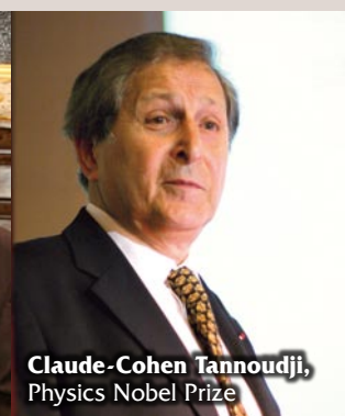
Claude-Cohen Tannoudji , Physics Nobel Prize