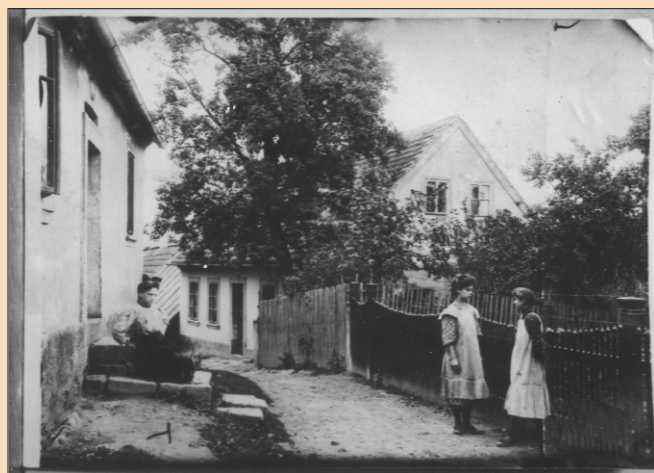
Rodný dům K. J. Erbena, fotografie z roku 1909