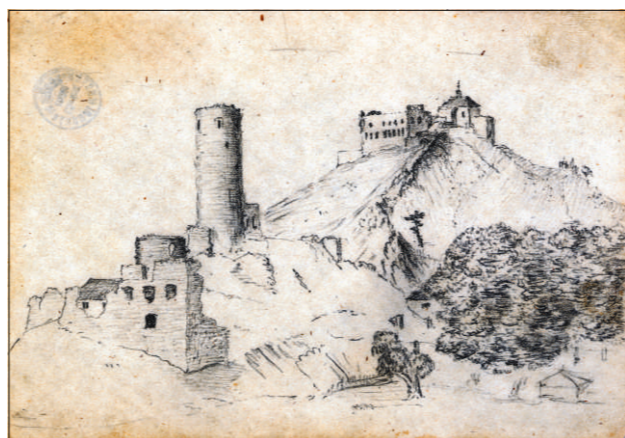
Žebrák a Točník, vlastní kresba K. J. Erbena, LA PNP

Erben otiskl baladu Poklad, jež mu přinesla uznání kritiky.