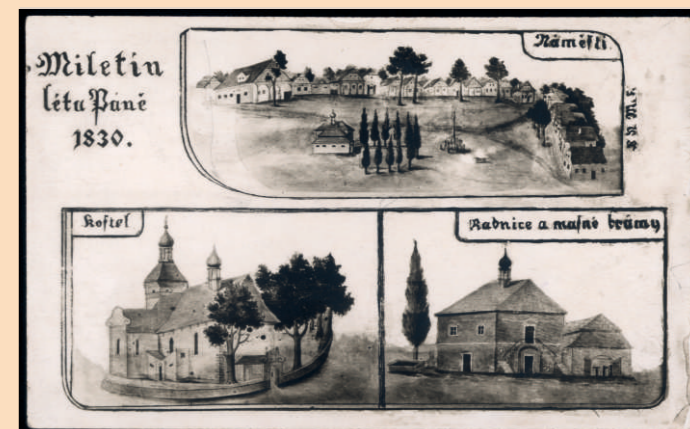
Pohlednice s kresbami J. K. Lhotý, LA PNP

Založena Měšťanská beseda v Praze, vzdělávací instituce, pořádající přednášky a kulturní akce, a současně elitní debatní klub.