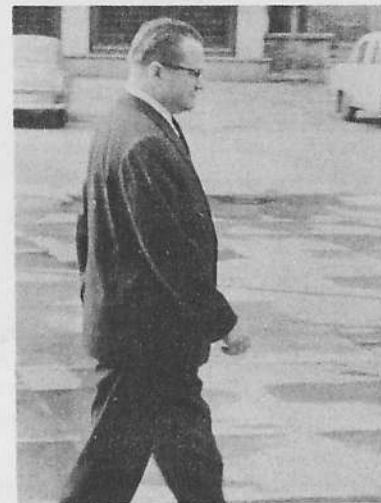
S.I. Červoněnko - sovětský velvyslanc v ČSSR