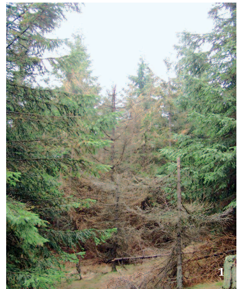
1 Smrkový porost v Jizerských horách strádající kvůli okyselení půd a nevhodnému hospodaření nedostatkem hořčíku.

Přesto se ale stav lesů výrazně nezlepšil. Nedochozí již sice k jednorázovým velkoplošným úhynům, ale chřadnutí lesů pokračuje. Průměrná defoliace smrku a buku v celé ČR (obr. 4) se mezi lety 1986–2003 nijak nesnížila, naopak se mírně zvýšila, přestože koncentrace \text{SO}_2 velmi poklesly. Defoliace je ztráta jehlic či listů oproti ideálnímu stavu plného olistění a je mírou zdravotního stavu stromů. Pokud je ztráta asimilačního aparátu nízká, má to na zdravotní stav jen malý vliv, jakmile ale překročí zhruba 40 %, strom začíná strádat nedostatkem látek, které jsou produktem asimilace probíhající