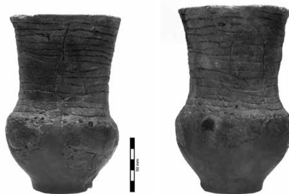
Obr. 6, 7 Stav šňůrového poháru VL 05/ 549; obj. 3602 po ošetření

Při použití pistole se střepy vykryjí např. lakýrnickou páskou, potravinářskou fólií apod., aby se zamezilo potřísnění původního střepového materiálu a byla ošetřena pouze výplň.