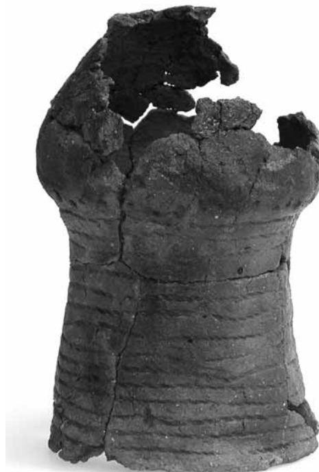
Obr. 3: Stav poháru po slepení

tentní ke stárnutí. Výborná povětrnostní odolnost. Odolnost vůči odlupování a vzniku trhlin. Dobrá světelná stabilita. Odolnost vůči UV záření. Nemění odstín ve slepu. Žádný zápach. Lepidla jsou nehořlavá. Jsou finančně méně náročná. Univerzální možnost aplikace různými postupy a jednoduchá čistitelnost pracovních nástrojů vodou. Zatím nebyl zaznamenán žádný negativní vliv disperzí na lidské zdraví. Akrylátové disperze nemají žádná toxikologická a fyziologická omezení. Likvidují se jako běžný domácí odpad.