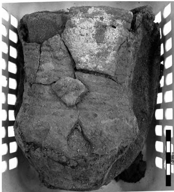
Obr. 1: Stav šňůrového poháru VL 05/ 549; obj. 3602 před restaurováním

Po očištění vnějších povrchů střepů byla provedena jejich stabilizace penetrací konzervačním roztokem. Výplň střepy v této fázi stále fixovala zevnitř. Po zpevnění se vždy druhý den pokračovalo v mechanickém odstraňování vnitřních vrstev výplně. Po vypreparování, dočištění druhé strany se zbývající plochy střepu opět stabilizovaly.