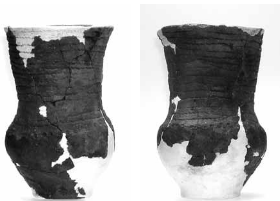
Obr. 4, 5: Stav poháru po doplnění ztrát

Po suché retuši byly předměty zbavovány všech stop po sádrování včetně separátoru a sádrového prachu šetrným omytím čistou vodou.