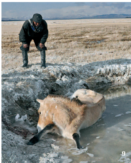
9 Terénní deprese se v katastrofální zimě na přelomu let 2009–10 staly pro mnohé koně smrtelnou pastí. Prameny Chonin Us, březen 2010.

Dominantní hřebec se musí starat také o vyhánění dospívajících jedinců ze stáda, čímž se vyloučí možnost příbuzenského páření (inbreedingu). Týká se to hlavně hřebců, kteří odcházejí do tzv. mládenec-kých neboli bakalářských stád (bachelor groups). Existence těchto skupin je z hlediska dynamiky populace nesmírně důležitá, protože se z nich rekrutují noví vůdci harémů. Pokud není vůdčí hřebec dostatečně silný a důrazný a nedokáže mladé hřebce vyhnat ze stáda, může v harému dojít k eskalaci sociálního napětí a rozbrojům. Víme, že úspěšnost reprodukce