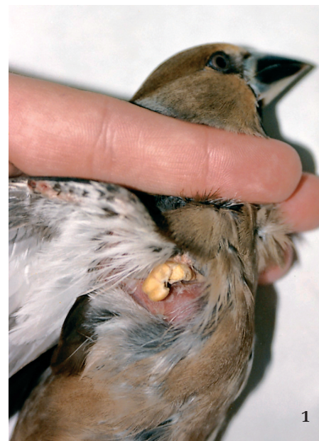
1 Kožní cysta s roztoči Harpirhynchus nidulans pod křídlem dlaska tlustozobého ( Coccothraustes coccothraustes ).

V r. 1877 popsal P. Mégnin nový rod Harpirhynchus a jako druh Harpirhynchus nidulans (typový druh rodu) označil roztoče, které našel v kožních cystách u „alouette“ – pravděpodobně skřivana polního ( Alauda arvensis ) – ve Francii. V dalším roce popis tohoto druhu roztoče zpřesnil a druh vyobrazil, uvažoval však