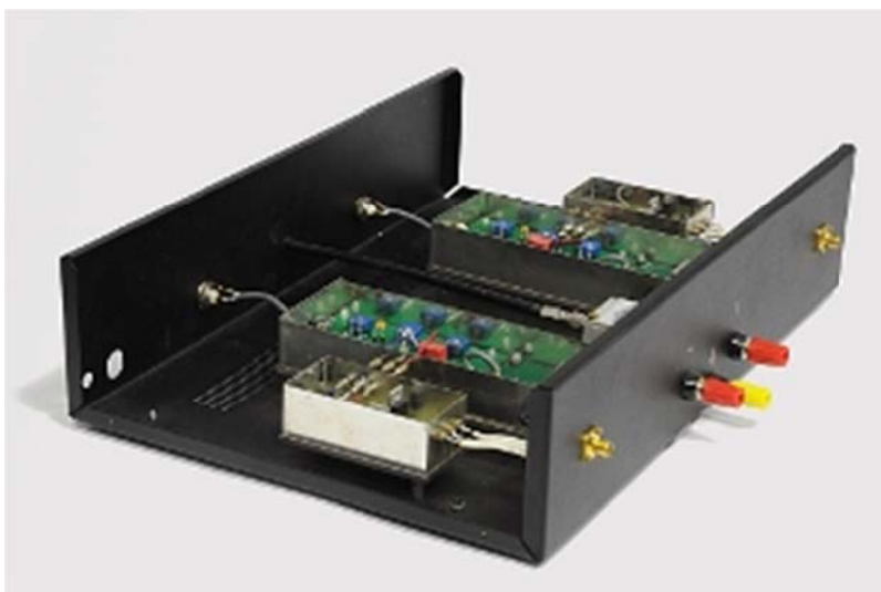
Obr. 3. Násobič časové odchylky využívající principu duálního směšování – klíčová část systému pro měření frekvenční stability oscilátorů

Při ověřování frekvenční stability nových typů vysoce stabilních krystalových oscilátorů BVA, které vyvíjí švýcarská firma Oscilloquartz, se významně uplatňují vynikající měřicí možnosti rozvíjené v Oddělení času a frekvence Ústavu fotoniky a elektroniky AV ČR, v.v.i. Šumové vlastnosti krystalových rezonátorů jsou nejprve vyhodnocovány ve francouzské laboratoři FEMTO-ST, Oscilloquartz tyto rezonátory poté zapracovává do krystalových oscilátorů. Frekvenční stabilita vybraných kusů oscilátorů je následně proměřována v ÚFE. Náš unikátní měřicí systém s nejnižší dosud publikovanou hodnotou vlastního šumu umožnil charakterizovat vlastnosti nového prototypu krystalového oscilátoru BVA. Byla u něho naměřena prahová hodnota šumu 2,5 \cdot 10^{-14} ve smyslu Allanovy odchylky. Poprvé za posledních 15 let tak opět došlo k výraznému zlepšení šumových vlastností krystalových oscilátorů, které znovu získávají na popularitě.