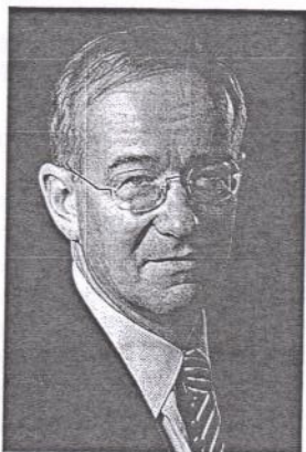
Richard Swedberg, jeden ze zakladatelů ekonomické sociologie. S Markem Granovetterem, Amitai Etzionim a dalšími patří mezi klasické autory tohoto směru

určitých okolností tvoří subjektivně významné referenční rámce (i) migrantských komunit, zatímco jejich vliv na majoritní společnost hostitelských zemí je obvykle zanedbatelný. Antropologizace ve smyslu orientace na sociálně sdílené a subjektivně zakoušené hodnoty, symboly a sociální entity je nezbytná i v případě migrační sociologie, která dosud namnoze vycházela z úzce demografických pozic. Jak totiž ukazují výzkumy jiných oblastí, například rodinného a reprodukčního chování, 43 ani v této „navýsost demografické“ sféře rozhodně nelze pracovat bez náležitých teoretických východisek, a tím spíše to platí u migračních procesů, které jsou dalekosáhle ovlivněny historickými, socio-kulturními, ekonomickými a dalšími aspekty.