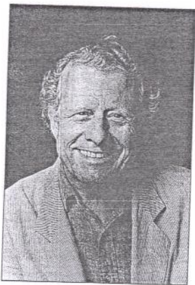
Charles Tilly, americký historik a sociolog. Proslavil se sociálním rozbořem francouzského protirevolučního povstání ve Vendée, později se věnoval především migračním studiím. V současnosti jeden z předních ekonomických historiků

zemi, respektive svým součastem v ní. „Pro etnické minority [jejich] kultura hraje klíčovou roli jako zdroj identity a základ rezistence vůči vylučování a diskriminaci ze strany majoritní společnosti.“ 25 Vzhledem k tomu, že značná část aktuálních migrací je jen dočasná, i když to u některých znamená období přesahující délku trvání jedné generace, a vzájemné vazby mezi emigračními a imigračními součástmi téhož společenství tvoří jejich významný prvek (například v podobě kapitálové výměny a „vysílání“ zástupců dané komunity do ciziny za prací), 27 mezi dvěma a více zeměmi vznikají relativně trvalé migrační systémy. Tvoří se na bázi historických, politických, ekonomických, sociálních a kulturních vazeb, v jejichž rámci dochází k migračním rozhodnutím a pohybům, a hraje při nich roli jak kulturní a symbolický kapitál, projevující se především v globálním, systémovém měřítku, tak kapitál sociální (rodinné a skupinové struktury, neformální sociální sítě) a kulturní; v poslední době však i organizovaný kapitál ekonomický, struktury ozna-