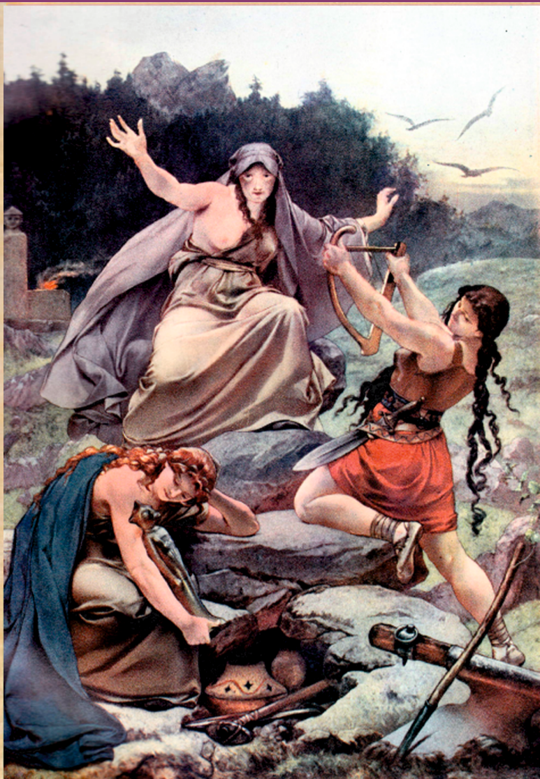
Nástěnná alegorická malba Mýtus , Mikoláš Aleš a František Ženíšek, návrh pro foyer Národního divadla, 70. léta 19. století