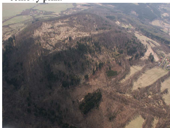
Obr. 6: Letecký snímek Vladaře s patrným jezírkem na akropoli bývalého hradiště.