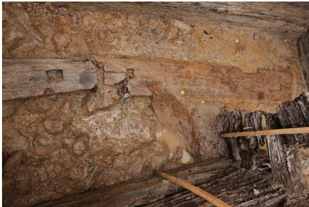
Obr. 3: Vladař, detail unikátní dřevěné konstrukce, (foto ARUP)