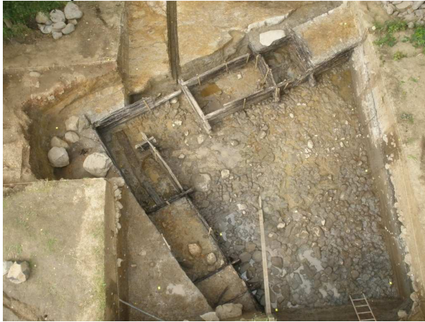
Obr. 1: Vladař, celkový pohled na unikátní dřevěnou konstrukci.