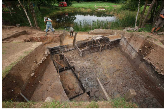
Obr. 2: Vladař, celkový pohled na unikátní dřevěnou konstrukci, pohled od východu.