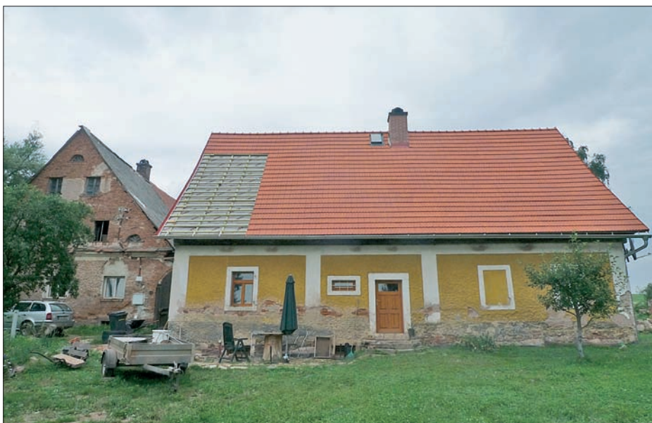
Nově příchozí obyvatelé investují do oprav venkovských objektů a přispívají k údržbě hmotného dědictví venkova.

Empty nesters neboli prázdná hnízda je anglický výraz pro rodiče ve středním věku, jejichž děti dospěly a opatřily si vlastní byd-