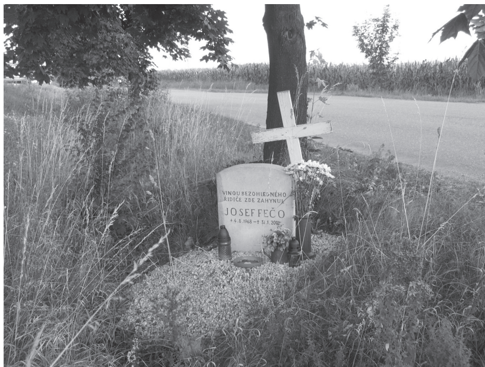
Obrázek 5. Pomníček u silnice na Orlickoústecku, kombinace vertikálního „náhrobku“ a dřevěného kříže; silnice č. 35, Vysoké Mýto.