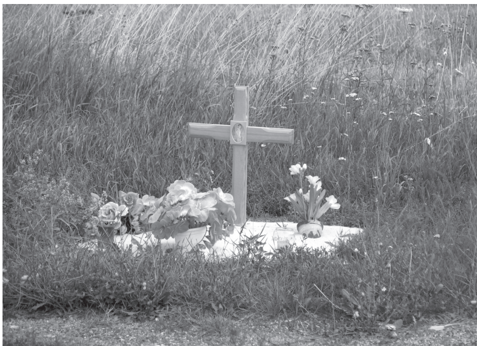
Obrázek 4. Dřevěný kříž s fotografií a umělé květiny na památku oběti dopravní nehody u Roudnice nad Labem, silnice č. 240. 22. 7. 2006.

rianty blíže popisující zármutek pozůstalých a jejich vztah k zemřelému, často prostřednictvím poetického vyjádření. Například: „Kdo se vryje do srdce, nikdy se z něho neztratí.“ „Krátké bylo tvoje žití, Bůh Tě k sobě povolal, a nám zarmouceným, velkou bolest zde na světě zanechal. Navždy budeš žít v našich srdcích.“ „Tak mlád a příliš bezstarostně, vydal se na cestu poslední. Osud zasáhl ho krutě, nelítostně, ale vzpomínky v srdcích navždy zní.“ Jednou bylo připomenuto, že smrt nebyla způsobena vlastní vinou oběti: „bez viny“. Ve dvou případech bylo přímo uvedeno: „vinou bezohledného řidiče“. Takové pomníčky pak nejen připomínají tragickou událost, ale zároveň se snaží veřejně poukázat na viníky nehody. Jim i okolní veřejnosti je prostřednictvím pomníčku čin neustále připomínán. Prvek viny ovšem nebyl akcentován v případě, že oběť zahynula vlastní vinou. Je zřejmé, že značná část obětí není hrdiny, ale oběťmi vlastního selhání, nebo selhání svých blízkých, kteří v danou chvíli řídili.