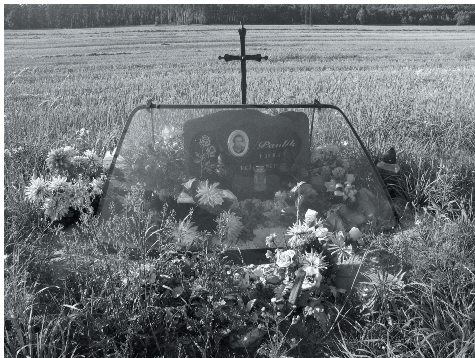
Obrázek 3. Pomníček u silnice na Kolínsku, silnice č. 322 mezi Lžovicemi a Veletovem. Pomníček sestává ze tří základních stavebních prvků: kamenného vertikálního „náhrobku“, čelního skla auta a kovového kříže. Dále obsahuje květiny a svíčky.

a nádoby na ně, které byly součástí 82 % pomníčků. Jiné drobné předměty se objevovaly spíše sporadicky, jednalo se o plyšové či plastické hračky, srdíčka, keramické figurky, případně části oblečení. Vyskytly se i předměty svědčící o osobních zájmech mrtvých – hokejka, kopačka, kytara, CD. Výjimečně se u pomníčků nacházely i cigarety nebo kondomy, zamýšlené patrně jako dary mrtvým. 14