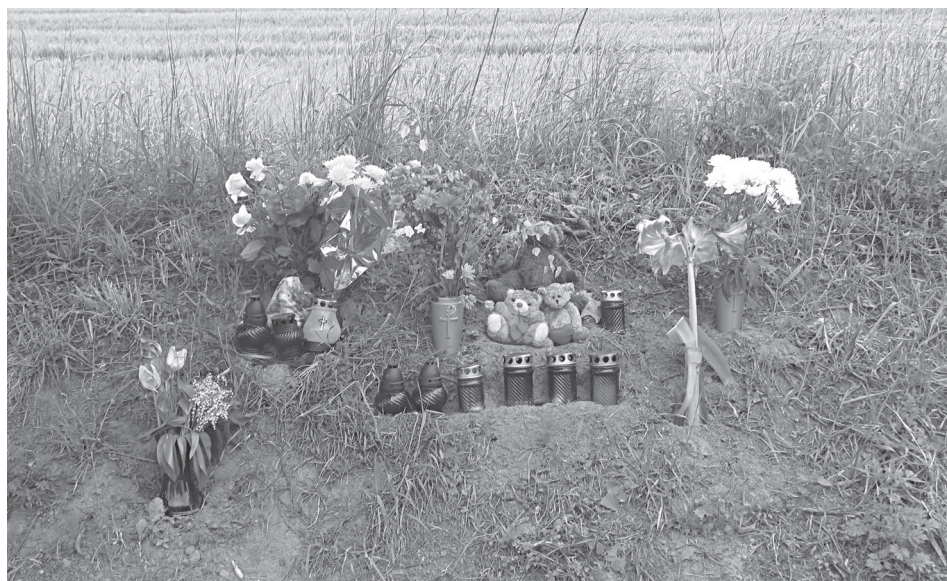
Obrázek 2. Předměty u silnice v místě dopravní nehody na Mělnicku, silnice č. 16 úsek Vysoká Libeň – Byšice.