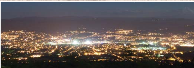
Měníme noční tvář krajiny skutečně ke svému prospěchu? Pohled na noční Liberec a Jizerské hory z Ještědu.

Když se snáší bezmračná noc, Jizerské hory nám odhalují ještě jeden svůj poklad – nebe poseté hvězdami. Pod otevřenou noční oblohou v Orle, Jizerce či na Smrku, uvidíme nad hlavami na 2 000 hvězd a překrásný stříbrný pás Mléčné dráhy. Takový pohled je bohužel stále vzácnější. Více než polovina Evropanů nemůže ze svého bydliště takovouto noční oblohu zahlédnout, a to kvůli světelnému znečištění.