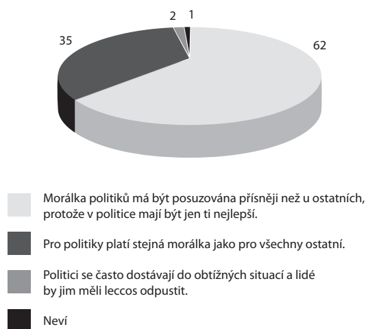
Graf 1: Jak by měla být hodnocena morálka politiků? 6

Téměř dvě třetiny oslovených v roce 2007 dále vyjádřily mínění, že morálka politiků by měla být posuzována přísněji než u ostatních. Názor, že pro politiky platí stejná morálka jako pro všechny ostatní, zastávala více než třetina občanů. Pouhá 2 % dotázaných uvedla, že politici se často dostávají do obtížných situací a lidé by jim měli leccos odpustit (viz graf 1). Lze tedy říci, že na osobnosti a morální profil politiků má česká veřejnost vysoké požadavky.