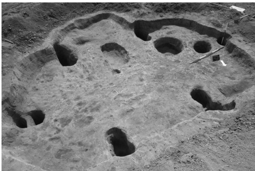
Abb. 4. Rousínov. Germanisches Grubenhaus.

Obr. 4. Rousínov. Germánská polozemnice.