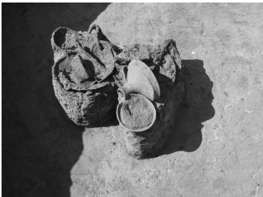
Abb. 3. Rousínov. Eisenfunde in der Siedlungsgube K 510.

Celkem bylo prozkoumáno 225 objektů, z nichž největší část patřila rozsáhlému sídlišti ze závěru starší doby římské. Množství kruhových či oválných sídlištních jam se soustřeďovalo kolem 8 polozemnic. Šest chat s pravidelnou typickou šestikůlovou konstrukcí a s vnitřní zahloubeninou u vchodu mělo vchodový výklenek na jižní nebo jihozápadní straně (obr. 4). Prozkoumané objekty sídlištního charakteru představují pouze část rozlehlého areálu, který dále pokračuje východním směrem. Dokladem mimořádného postavení tohoto sídliště je i nález železného depotu (obr. 3) v jedné ze sídlištních jam (K 510). Depot zahrnoval poškozené nářadí (kladiva, sekyry), části kola (náboj a vnější obruč), části věder, držadlo kotlovité nádoby, zemědělské nářadí (motyky, kosy, srpy). Spolu se železnými předměty byly nalezeny i dvě misky na duté nožce, které celý soubor datují do stupně B2.