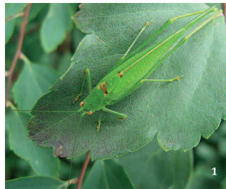
1 Samec kobylky malé ( Phaneroptera nana ) na tavolníku van Houtteově ( Spiraea × vanhouttei ) pozorovaný v parku na Karlově náměstí v Praze (2013)

a dosud se jí podařilo najít na několika pražských lokalitách v souvislosti s projektem Mapování rovnokřídlých v ČR – tato data však zatím nebyla publikována.) V atlasu Rovnokřídlí České republiky (Kočárek a kol. 2013) autoři uvádějí výskyt dospělců od července do října a druh považují za arborikolní – kobylky malé žijí v korunách stromů a vyšších keřů. Samci zde v noci cvrkají; stridulace, která u toho-