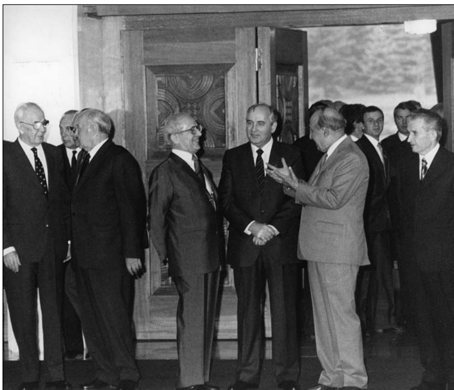
Komunistický summit nadějí i obav. Dveře, které Gorbačov otevřel změnám, přinesly do Sovětského svazu i jeho satelitů notný průvan (v popředí zleva Gustáv Husák, Todor Živkov, Erich Honecker, Michail Gorbačov, János Kádár a Nicolae Ceaușescu

nebudeme odcházet s chybami.“ 19 Z existenčních obav těch, kteří počátkem srpna 1968 podepsali a odeslali do Moskvy „zvací dopisy“, je znát, že potencialita změny působila mocně a neodbytně.