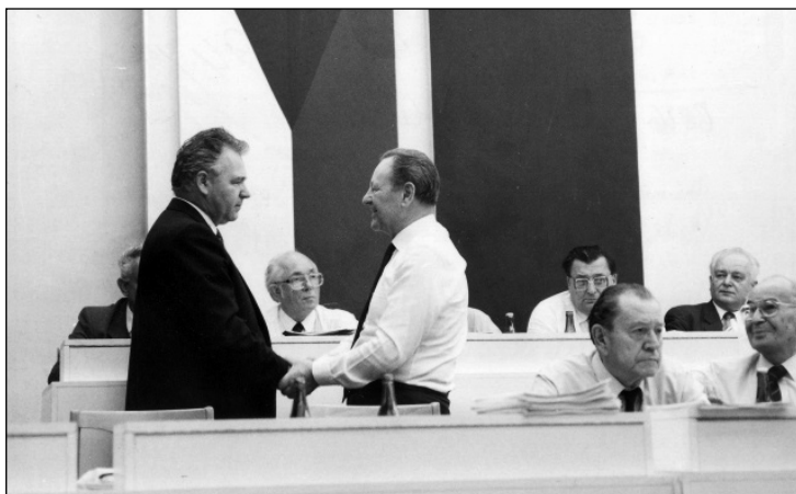
Symbolický okamžik vítězství občanské vůle: na zasedání Ústředního výboru KSČ 24. listopadu 1989 Miloš Jakeš (vpravo) předává funkci generálního tajemníka Karlu Urbánkovi. V popředí vpravo přihlížejí předseda Federálního shromáždění Alois Indra a prezident republiky Gustáv Husák

zůstat ve funkcích a dál řídit stát pevnou rukou. 56 Bylo naprosto zásadní politickou a strategickou chybou rezignovat ve zlomové situaci jen proto, že to chtěla „ulice“! Znamenalo to pustit z rukou otěže moci! A tak se stalo, že v klíčových dnech, kdy bylo třeba pádných rozhodnutí na obranu socialismu, nebyl po ruce nikdo, kdo by je autoritativně vynášel. Pro komunisty je to druhé „poučení z krizového vývoje“ – a je zřejmé, že oni svého sametového listopadu ‘89 z hloubi duše litují.