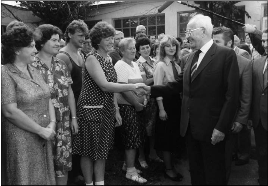
Socialismus – nejen vyprázdněná „šifra“ (Václav Havel), ale také věc, na kterou nedáme dopustit. Stisk ruky mezi prezidentem Gustávem Husákem a členkou pracovního kolektivu stvrzoval jednotu strany a lidu