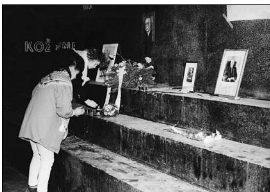
Spontánní pietní akt u sochy sv. Václava na Václavském náměstí. Brutální policejní zákrok na Národní třídě spolu se zprávou o smrti studenta rozechvěly citlivou strunu národní paměti a přivolaly symbolické momenty českých dějin spjaté s obětmi dvou Janů – Opletala (17. listopadu 1939) a Palacha (15. ledna 1969)