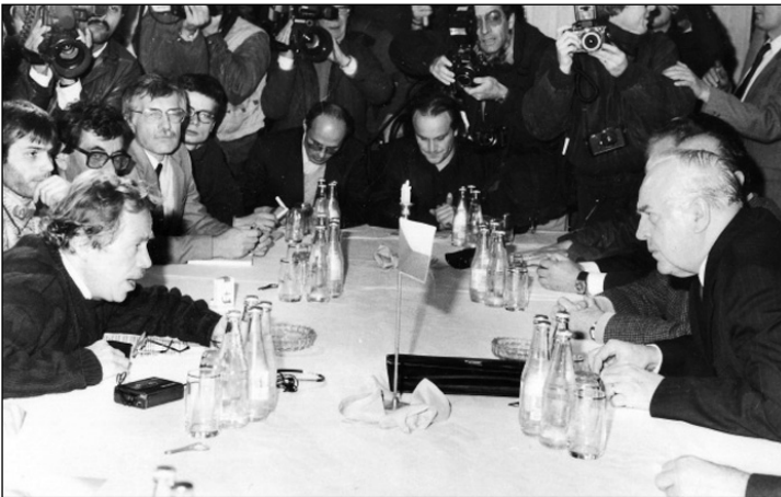
Občanské fórum jako hybatel revolučního hnutí nezvolilo cestu diktátu z pozice síly, ale trpělivého vyjednávání. Rozhovory mezi představiteli opozice a státní moci začaly 26. listopadu v Obecním domě, v popředí Václav Havel a předseda federální vlády Ladislav Adamec jako vůdčí osobnosti obou táborů

let) stejně stala rozhodujícím integrujícím prvkem postkomunistické levice. Soupeření s pravicí ve většinovém systému by shromáždilo pod jednu střechu obnovenou sociální demokracii (v první polovině devadesátých let velmi nevýraznou), Komunistickou stranu Čech a Moravy, klub Obroda a další, menší levicové subjekty.