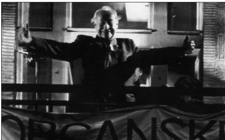
Alexander Dubček v symbolickém objetí s davem v listopadu 1989. Mezi lidmi měl zpočátku největší podporu ze všech možných prezidentských kandidátů