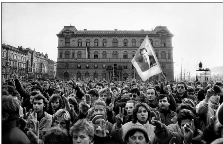
Představitelům Občanského fóra a Veřejnosti proti násilí se nakonec podařilo odvrátit riziko, že jejich společný kandidát na prezidenta bude muset podstoupit konfrontaci se soupeři v dlouhé kampani před lidovým hlasováním. Studenti si heslo „Havel na Hrad!“ vzali za své

hodně nepřálo: stůj co stůj chtělo postupovat podle ústavy, ústavní krize se děsilo. V patové situaci bylo záhy jasné, že do konce roku 1989 prezident zvolen nebude. Proto se politické strany u „kulatého stolu“ 13. prosince shodly, že bude nezbytné prodloužit lhůtu ke zvolení nového prezidenta ze čtrnácti na pětadvacet dnů! 76