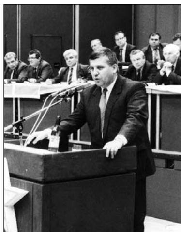
„Republiku si rozvracet nedáme!“ První tajemník Městského výboru KSČ v Praze Miroslav Štěpán při projevu v týdnu občanských protestů. Kdyby stranické vedení postupovalo podle jeho představ, nevydalo by moc z rukou dobrovolně

Ve své řeči na zmíněném zasedání Ústředního výboru KSČ vyzval ministr Václavík členy předsednictva strany, aby zůstali ve svých funkcích a nepodlehli tlaku ulice. A tuto výzvu podpořil návrhem konkrétních opatření: „Ano, máme ještě možnost politickými prostředky tuto situaci zvrátit. ...navrhují uvést do bojové pohotovosti armádu, Bezpečnost, milici bez nějakých zásahů atd., aby tyto složky byly připraveny, jestliže k něčemu dojde, věci řešit. Není možno, soudružky a soudruzi, čekat, až nám něco udělají, je potřeba mít tyto síly připraveny. Já nevolám tady po žádném krveprolití, já navrhuji, aby jednoznačně byla přijata opatření k sdělovacím prostředkům. Jakákoliv, jestliže ne po dobrém, tak po zlém, ale tyto sdělovací prostředky jim vzít z rukou.“ 52 Nedochovala se žádná zpráva o diskusi či o hlasování o těchto návrzích. Tehdejší generální tajemník Miloš Jakeš po letech komentoval situaci velmi lakonicky: „Na návrh Václavíka ... vedení nereagovalo. Šlo o vyhlášení mimořádného stavu.“ 53 Jakešovo předsednictvo rovněž nedalo na doporučení, aby zůstalo ve funkcích, a rozhodlo se odstoupit.