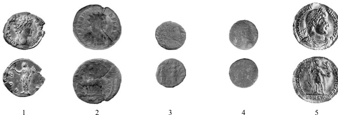
Obr. 2. Nálezy římských mincí z Českokrumlovska: 1 Slupenec, 2 Český Krumlov (č. A1), 3 Český Krumlov (č. A2), 4 Český Krumlov (č. B1), 5 Český Krumlov (č. C1).

Abb. 2. Die römischen Münzen aus dem Kreis Český Krumlov.