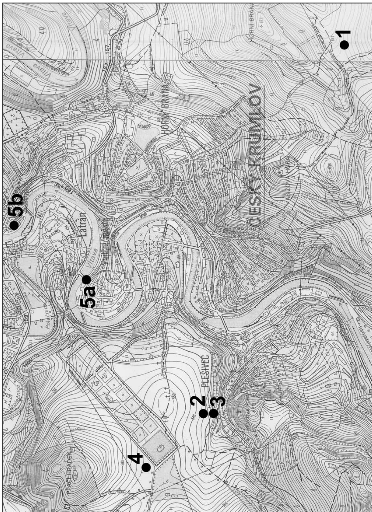
Obr. 1. Lokalizace nálezů římských mincí ze Slupence a Českého Krumlova: 1 Slupenec, 2-3 Český Krumlov (č. A1-2), 4 Český Krumlov (č. B1), 5a – 5b Český Krumlov (č. C1).