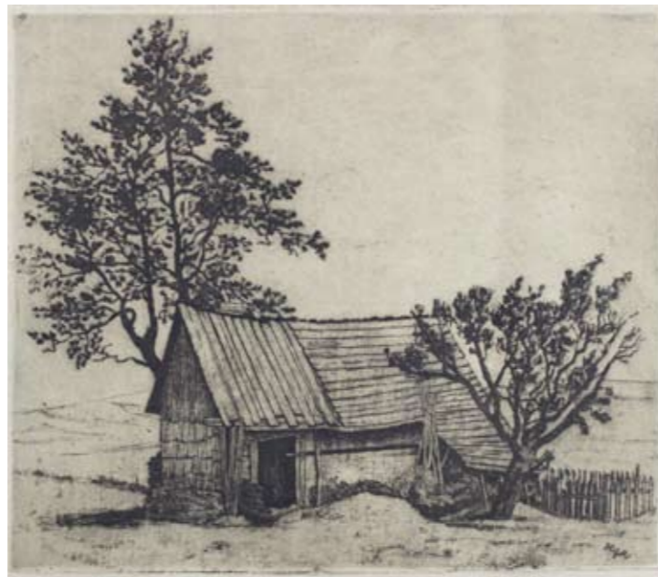
Herbert Masaryk, Stavení v polích, [1914], lept