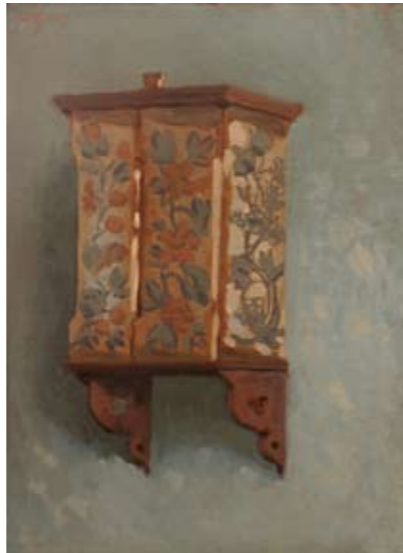
Herbert Masaryk, Malovaná skříňka, 1914, olej na plátně adjustovaném na lepenku 39,5×30 cm

2014/05/25-2017/12/31 Stav mysli – Za obrazem, stálá expozice GASK, Kutná Hora