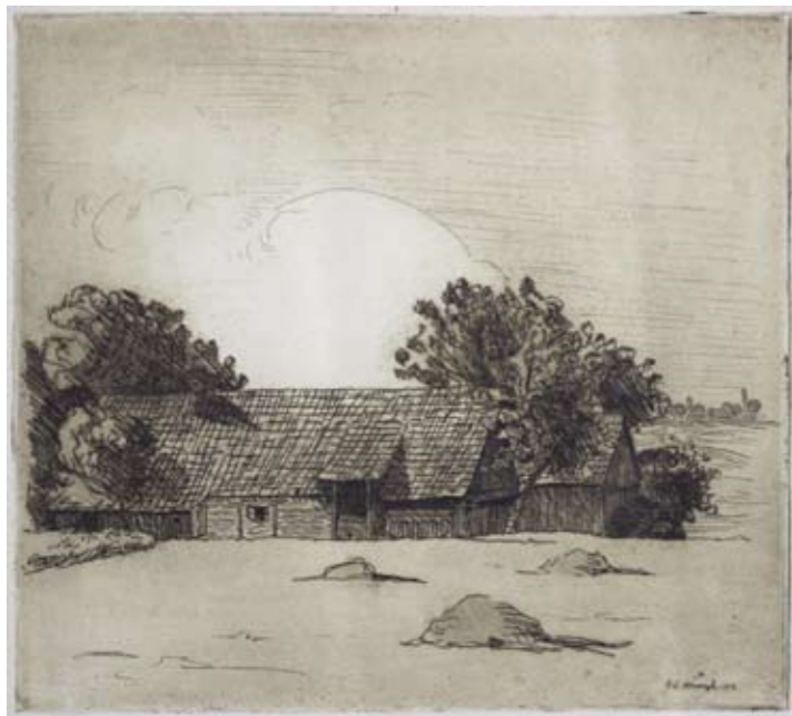
Herbert Masaryk, Samoty u Nebeské Rybné, 1914, lept