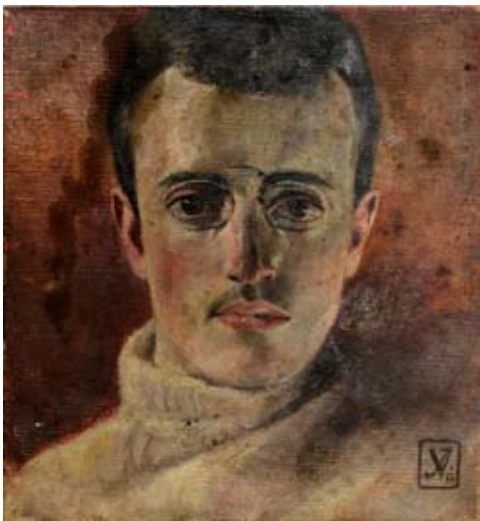
Neznámý jihoslovanský malíř, Podobizna Herberta Masaryka, 1899, olej na plátně 24×22 cm