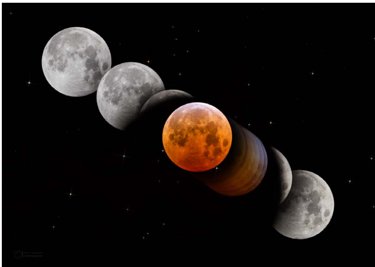
Barvy Měsíce při jeho zatmění 8. října 2014.

Petr Horálek Vedoucí redaktor Astro.cz horalek@astro.cz GSM: +420 736 124 431