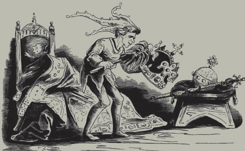
My: Musíme to uvést do pořádku, neboť čert houby ví, co Pánbůh dá!