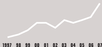
Státní podpora výzkumu a vývoje v ČR (v % HDP)

Neinvestiční zdroje AV ČR v roce 2007 byly tvořeny z 56,3 % prostředky vlastní kapitoly státního rozpočtu, z 18,3 % převody z ostatních kapitol státního rozpočtu a z 25,4 % vlastními tržbami a mimorozpočtovými prostředky. Podíl posledních dvou složek ve srovnání s předchozím rokem opět vzrostl.