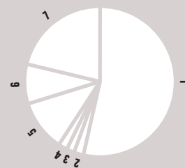
Struktura mezd zaměstnanců veřejných výzkumných institucí v %

V roce 2007 bylo provedeno 14 řádných a dvě mimořádné kontroly pracovišť AV ČR. Byly provedeny kontroly poskytnutých dotací 15 projektů ve čtyřech vědeckých společnostech. Z přiděleného objemu finančních prostředků bylo kontrole podrobena 16,4 %. Zároveň bylo prověřeno 12 z 67 řešených výzkumných záměrů (17,9 %), 55 z 644 grantových projektů (8,5 %) a 13 ze 152 programových projektů (8,5 %). Na pracovištích Akademie věd bylo provedeno 10 následných kontrol plnění opatření k odstranění nedostatků zjištěných předchozí kontrolou hospodaření.