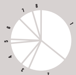
Struktura zaměstnanců veřejných výzkumných institucí (v %)