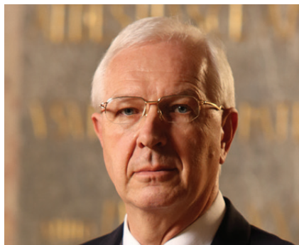
prof. Ing. Jiří Drahoš, DrSc., dr. h. c.

Vážené dámy a pánové, jsem rád, že se podařilo navázat velmi intenzivní spolupráci Poslanecké sněmovny Parlamentu ČR s Akademií věd ČR, které si cením jako tradiční a přitom velmi úspěšné české vědecké instituce. Seminář společně organizovaný při příležitosti 70. výročí ukončení II. světové války je jen jedním z příkladů této spolupráce. Letos je to již tři roky od podpisu Memoranda, které propojení obou institucí upravuje, a za tuto dobu se společnými silami udělalo mnoho práce. Věřím, že v ní budeme úspěšně pokračovat i nadále, kupříkladu při přípravách oslav 700. výročí narození Karla IV., chystaných na příští rok.