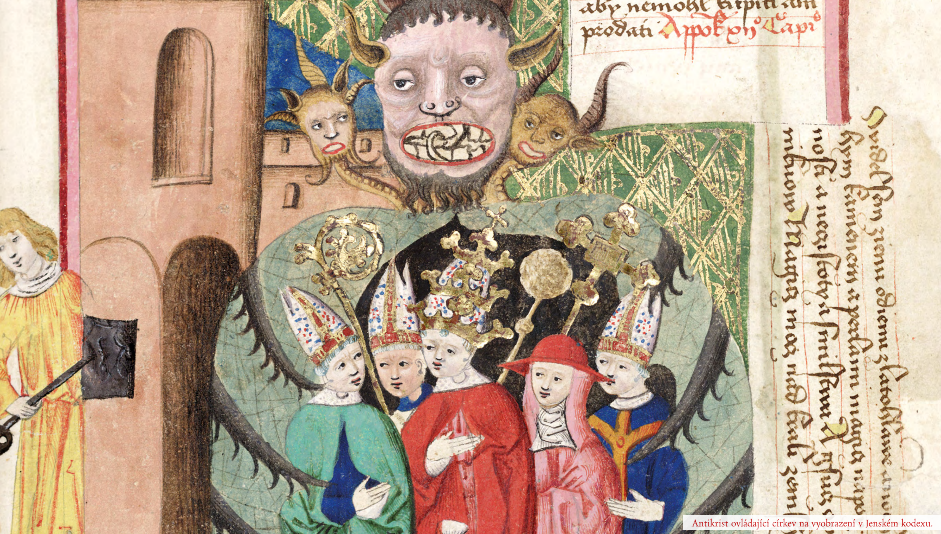
Antikrist ovládající církev na vyobrazení v Jenškém kodexu.