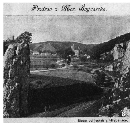
Pozdrav z Mor. Švýcarska.