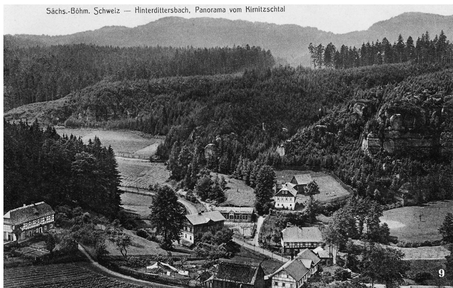
Sächs.-Böhm. Schweiz — Hinterdittersbach, Panorama vom Kirnitzschtal