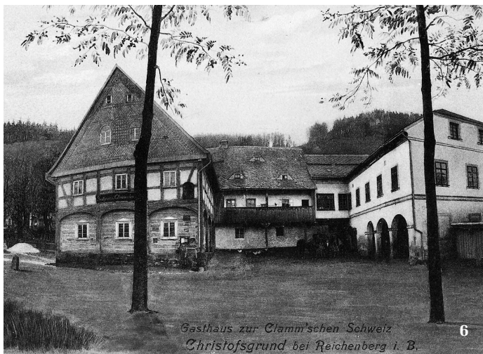
Gasthaus zur Clamm'schen Schweiz Christofsgrund bei Reichenberg i. B. 6