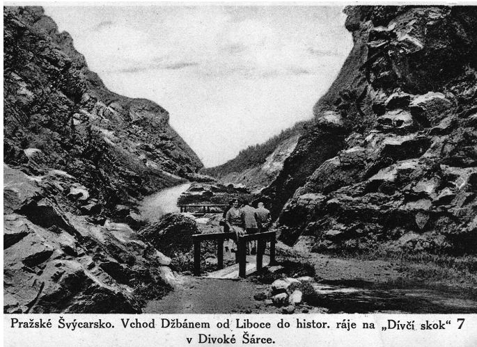
Pražské Švýcarsko. Vchod Džbánem od Liboče do histor. ráje na „Divčí skok“ 7 v Divoké Šárce.

2 V národním parku Gran Sasso e Monti della Laga leží Středoitalské Švýcarsko – nejvyšší horská skupina italských Apenin Gran Sasso.