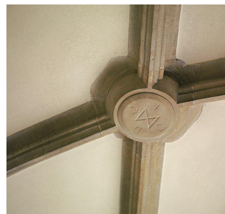
1 Detail Křížové chodby v Karolinu – historickém sídle Univerzity Karlovy.