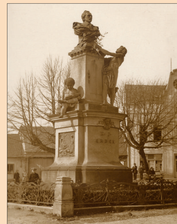
Pomník K. J. Erbena v Miletičíně, pohlednice z roku 1931

21. listopadu zemřel v Praze K. J. Erben na žloutenku. Pochován je na Olšanském hřbitově.