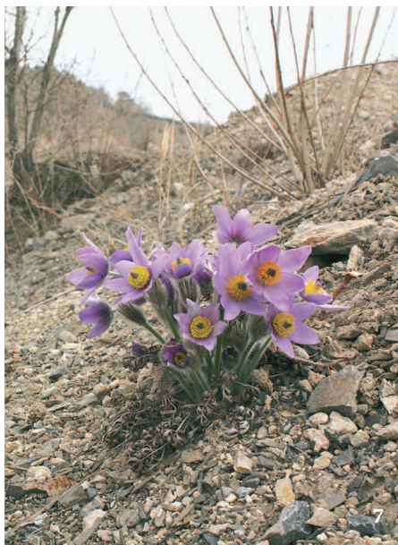
7 Koniklec velkokvětý ( Pulsatilla grandis ) na odvalu vápencového lomu na Hádech u Brna

Úspěšná ekologická obnova musí nutně vycházet z vědeckých poznatků, přičemž i v ekologii jako takové je základním metodickým přístupem experiment. Také v ekologii obnovy nějakého místa by bylo žádoucí předem uskutečnit dobře založený experiment, na to však většinou není čas. Navíc, pokus musíme uspořádat tak, aby se výsledky daly statisticky vyhodnotit, tj. abychom měli především dostatek nezávislých opakování a experimentální plochy byly reprezentativní. Tyto požadavky nás nutí použít malé plochy o velikosti většinou do několika m 2 . Můžeme si to třeba představit na příkladu vlivu seče na louku. Z hlediska vědeckého experimentu není možné třeba horní půlku louky sekat a druhou nechat nesečenou jako kontrolu, i když každou část s velkým množstvím vzorkových ploch, např. fytoocenologických snímků, odběrů půdních vzorků či pastí. Ty by byly tzv. pseudoreplikacemi. Mohlo by se totiž stát, že vliv seče přehluší, nebo alespoň silně ovlivní např. rozdíly ve vlhkosti horní a dolní části louky. Musíme proto kosené a nekosené plošky promíchat a to velmi komplikuje technické zajištění experimentu ve větším prostrovém měřítku a alespoň při pěti opakováních v každé variantě. Naopak praktické ekologické obnově jde většinou o to, aby zajistila vhodný zásah na co největší ploše. Výsledky z malých ploch se navíc mohou lišit od toho, jak se obnova realizuje na plochách velkých (jiné vstupy semen, jiné mikroklima, jiná aktivita herbivorů