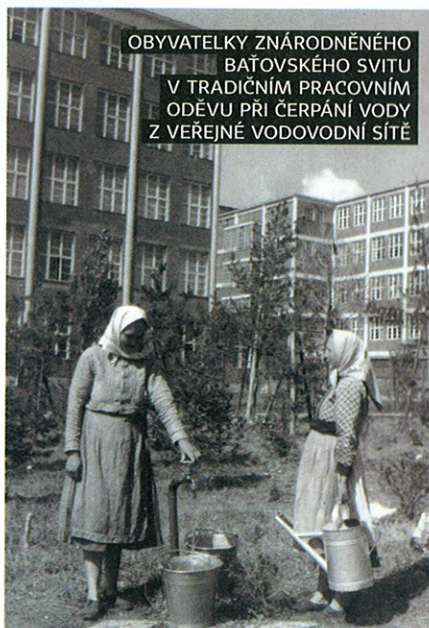
OBYVATELKY ZNÁRODNĚNÉHO BAŤOVSKÉHO SVITU V TRADIČNÍM PRACOVNÍM ODĚVU PŘI ČERPÁNÍ VODY Z VĚŘEJNÉ VODOVODNÍ SÍTĚ

Speciálně masově budované rodinné domky byly jistě prvkem, s nímž se jen stěží mohl vnitřně identifikovat. Když viděl pracovní tempo a odlidštěnou rutinu v továrnách,