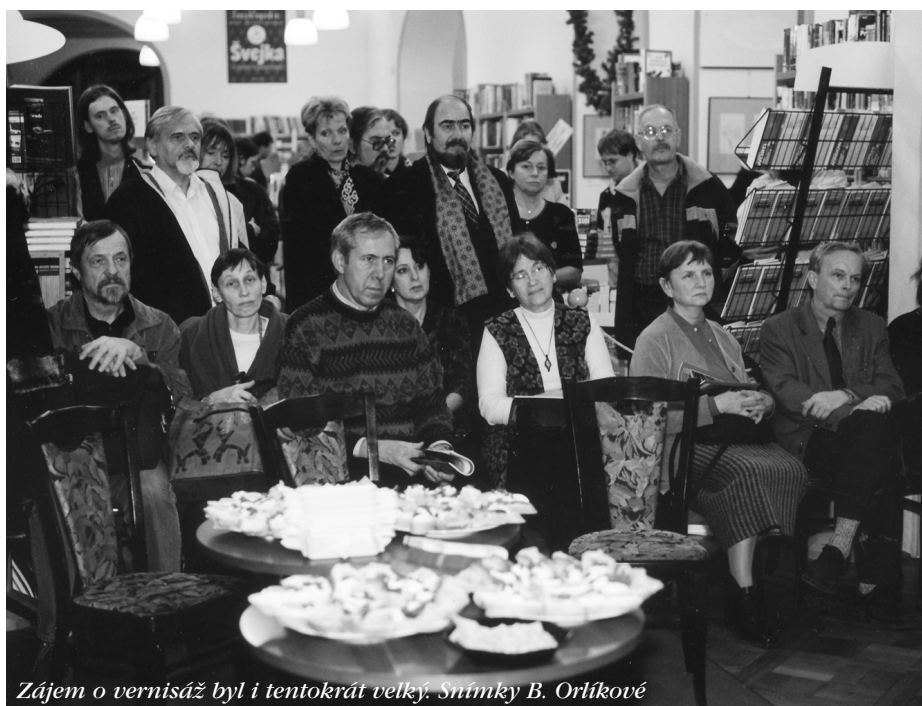
Zájem o vernisáž byl i tentokrát velký.