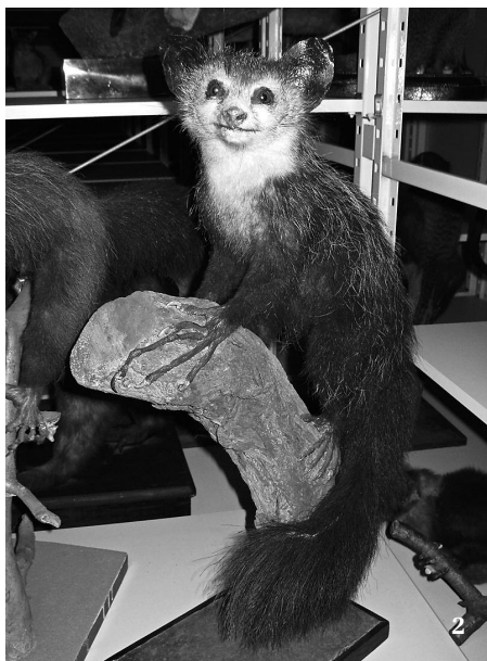
2 Výsledek reparaace ksukola ocašatého ( Daubentonia madagascariensis) ze sbírek Národního muzea v Praze.