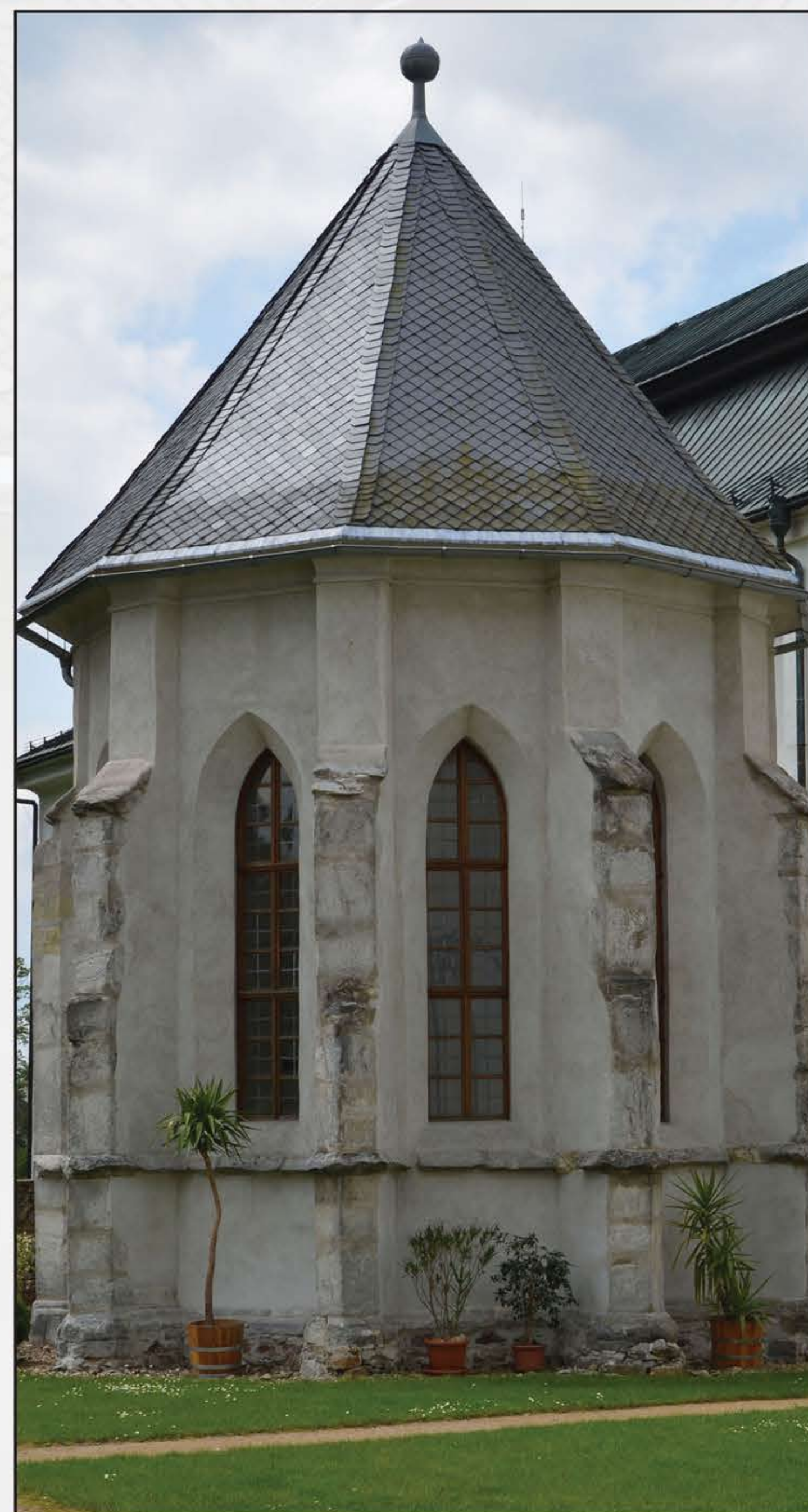
Gotická studniční kaple žďárského kláštera, 1250–1275