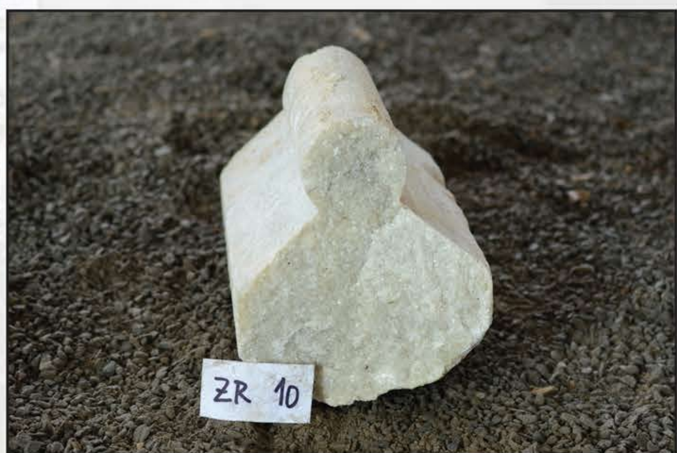
Fragment mramoru z okenního sloupku kružbového okna cisterciáckého kláštera ve Žďáru nad Sázavou, 1250–1275

Základem ověřovací studie je kvantifikované určení mineralogického složení mramorů pomocí práškové rentgenové difrakce a petrografického popisu výbrusů a nekarbonátových zbytků po rozpuštění v kyselině octové. Navazující analytickou fází je upřesnění chemického složení hornin a stanovení izotopů uhlíku ( \delta^{13}\text{C} ) a kyslíku ( \delta^{18}\text{O} ). Cílem analytických metod je určení charakteristických znaků jednotlivých zdrojů mramorů a jejich porovnání s použitými mramory zejména v gotické části kláštera. Podstatnou součástí studie je identifikace historických surovinových zdrojů, znalost stavební historie objektů a správné zařazení nalezených fragmentů gotických mramorových prvků.