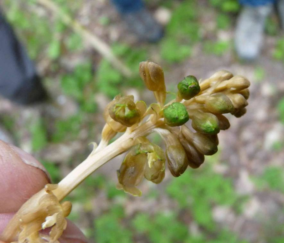
Hlístník hnízdák ( Neottia nidus-avis ) nezelená rostlina, která po zahřátí plamenem zápalky vytvoří v buňkách chlorofyl