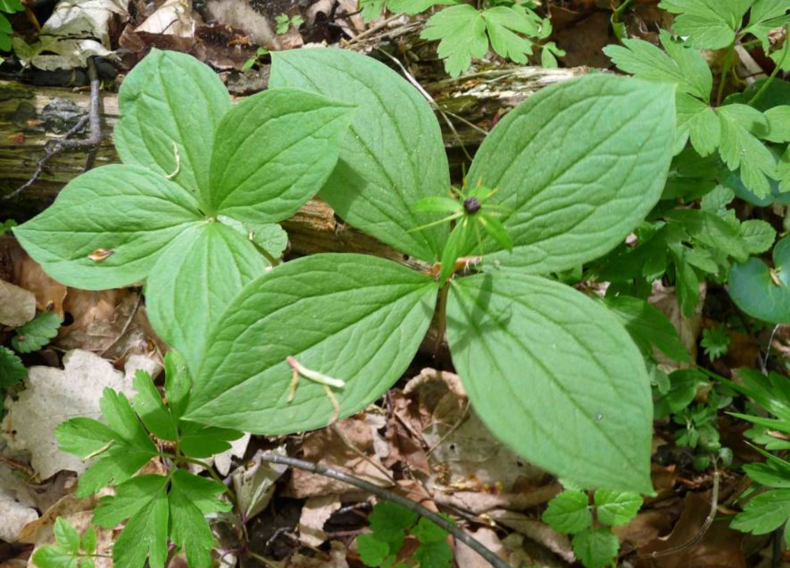
Vraní oko čtyřlísté ( Paris quadrifolia ), jedovatá rostlina. Zde již po odkvětu.