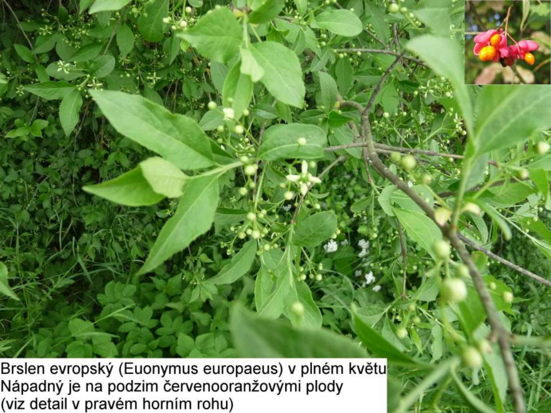
Brslen evropský ( Euonymus europaeus ) v plném květu Nápadný je na podzim červenooranžovými plody (viz detail v pravém horním rohu)