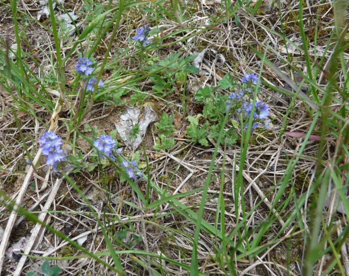
Rozrazil rozprostřený ( Veronica prostrata ) na skalkách a kamenitých cestách