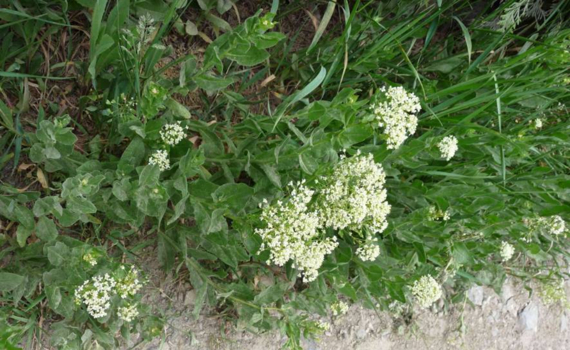
Vesnovka obecná ( Lepidium draba , dříve Cardaria draba ) na jaře 2-3 týdny bohatě kvete, zbytek roku je nenápadná.