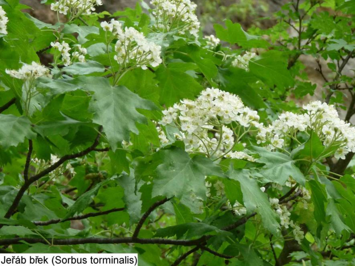
Jeřáb břek ( Sorbus torminalis )