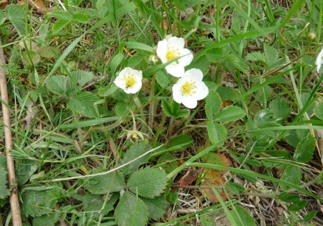
Jahodník obecný ( Fragaria vesca ), běžnější v trávnicích, má drobnější plody