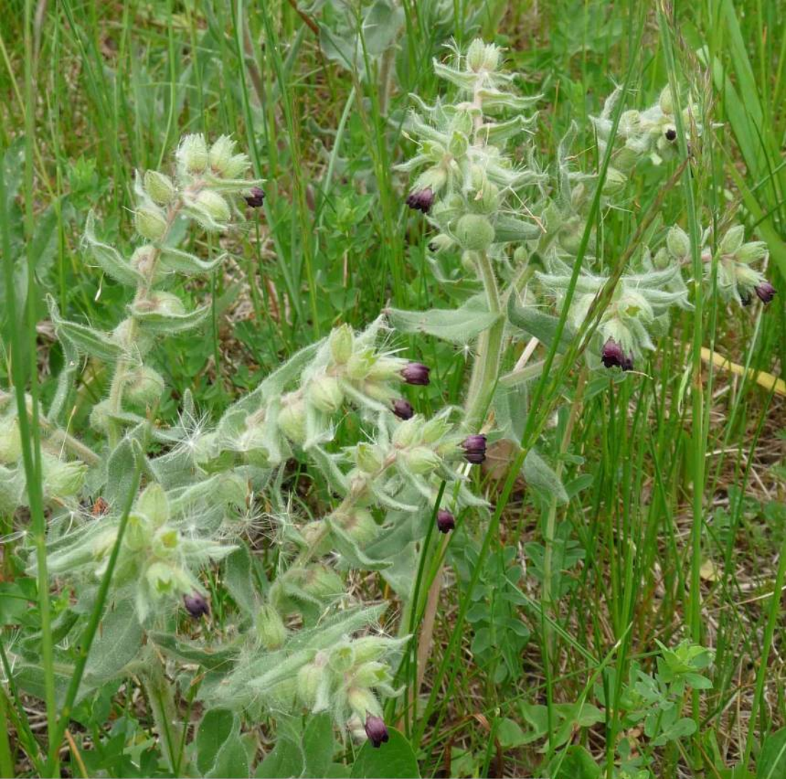
Pipla osmahlá ( Nonea pulla ), z čeledi brutnákovitých