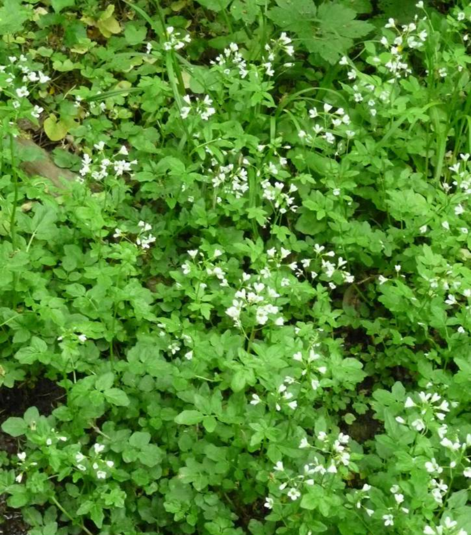
řeřicha hořká ( Cardamine amara ), rostlina mokrých stanovišť