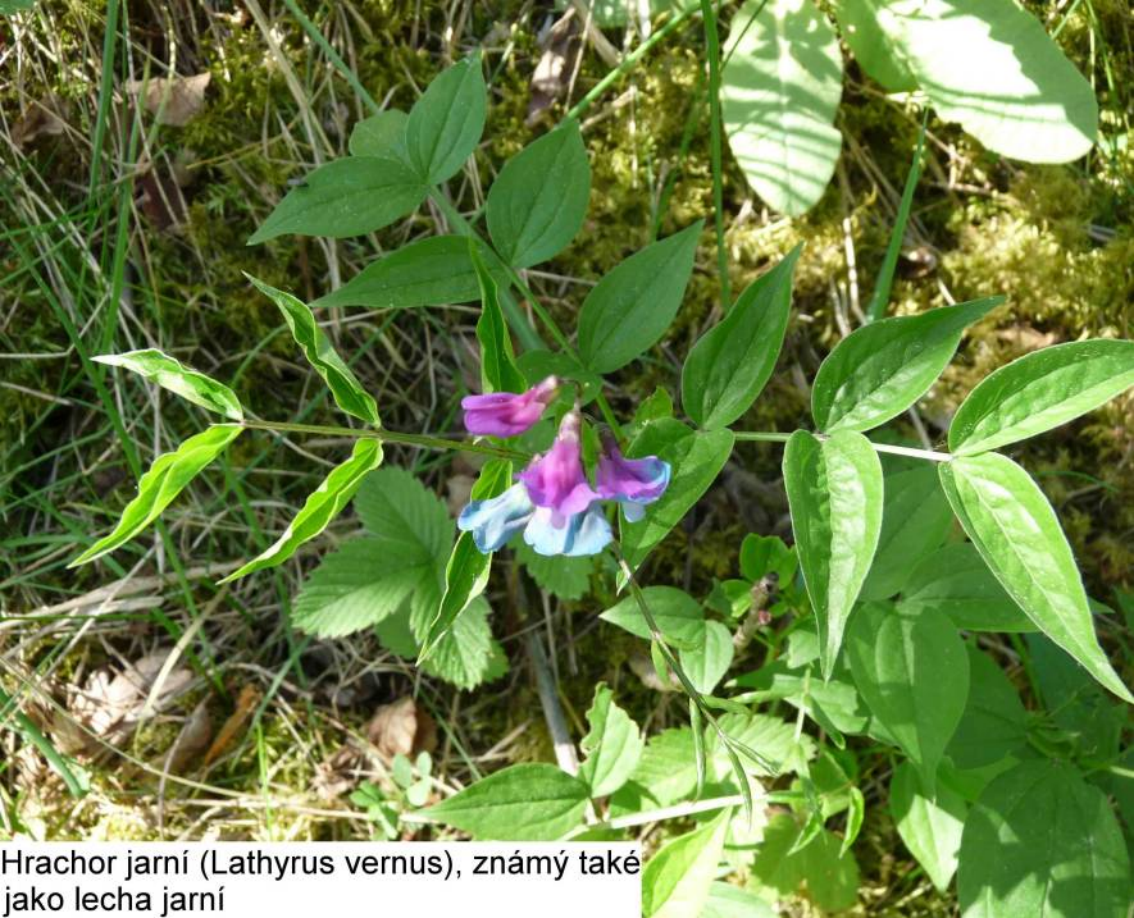
Hrachor jarní ( Lathyrus vernus ), známý také jako lecha jarní