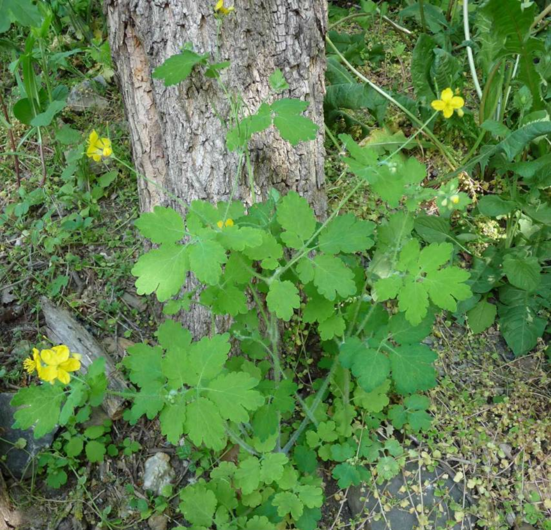
Vlaštovičník větší ( Chelidonium majus ) z čeledi Papaveraceae