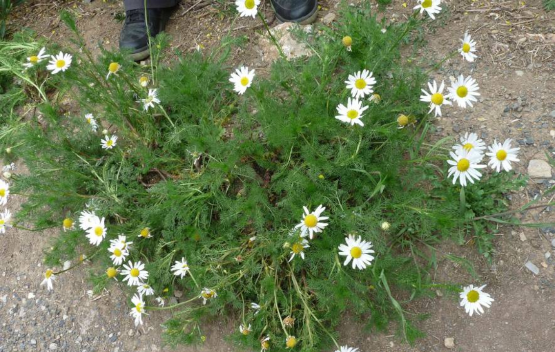
Heřmánkovec nevonný ( Tripleurospermum inodorum ), běžný polní plevel