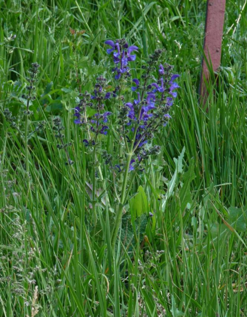
Kvetoucí šalvěj luční ( Salvia pratensis )