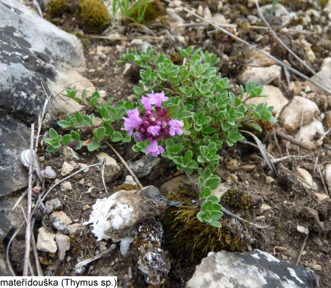
mateřidouška (Thymus sp.)