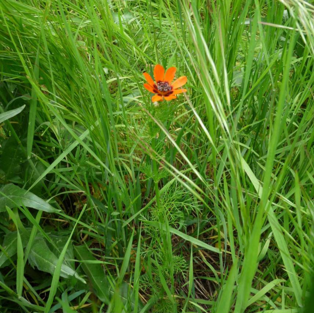
Hlaváček letní ( Adonis aestivalis ), polní plevel