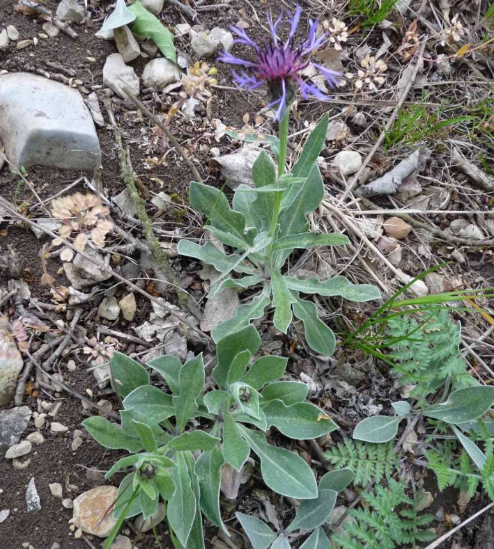
Chrpa chlumní ( Centaurea triumfetti ) v květu