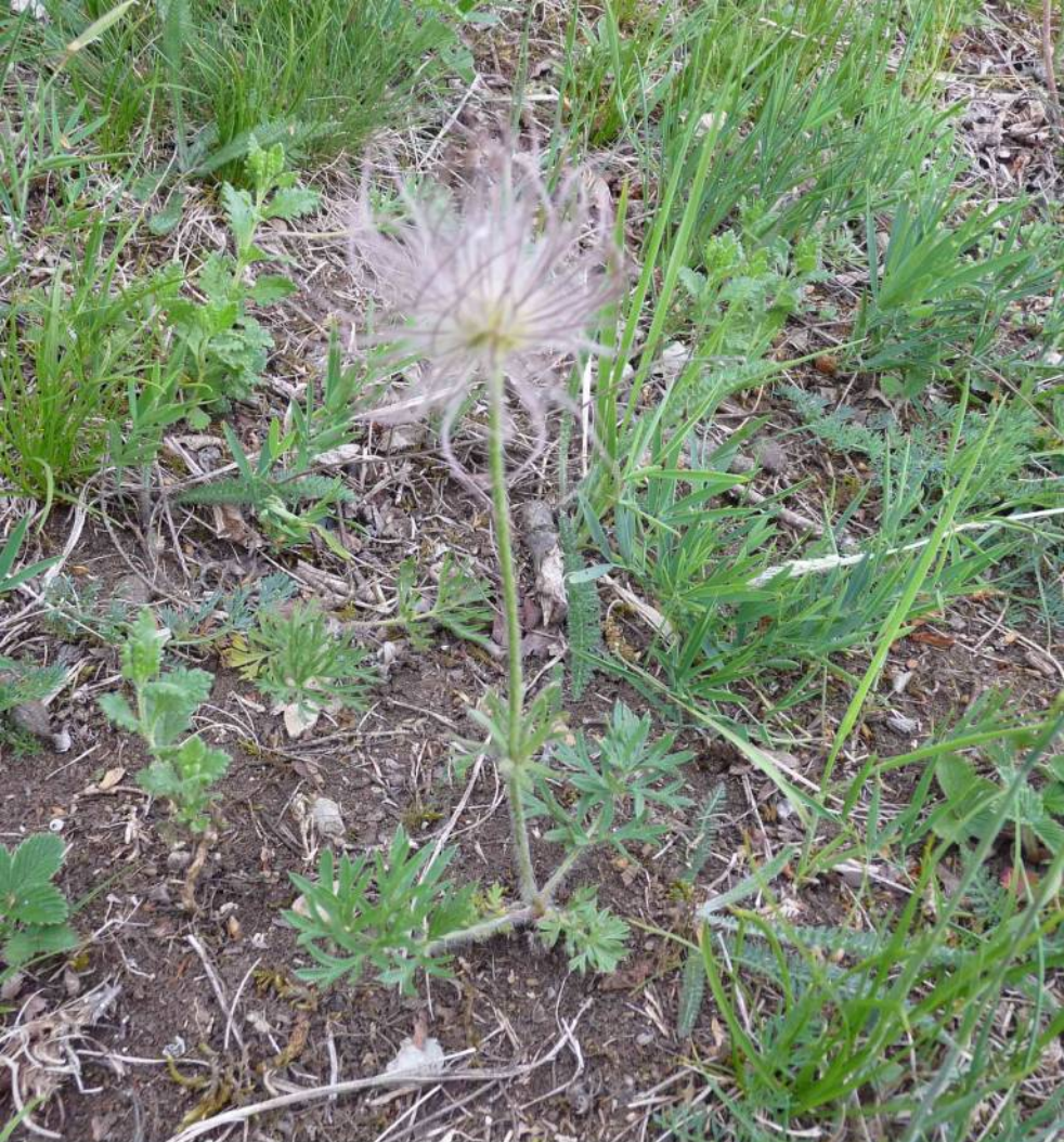
Koniklec ( Pulsatilla patens v. nigricans ) již má téměř zralá semena