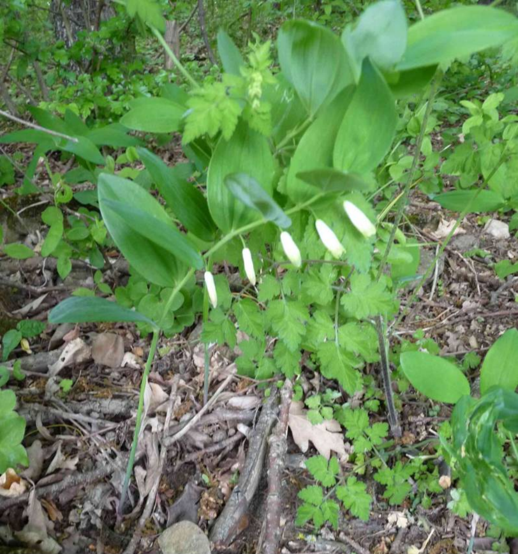
Kokořík vonný ( Polygatum odoratum )