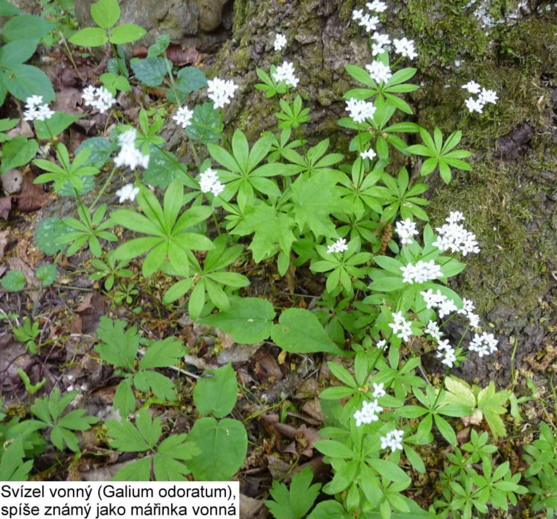
Svízeľ vonný ( Galium odoratum ), spíše známý jako mářinka vonná