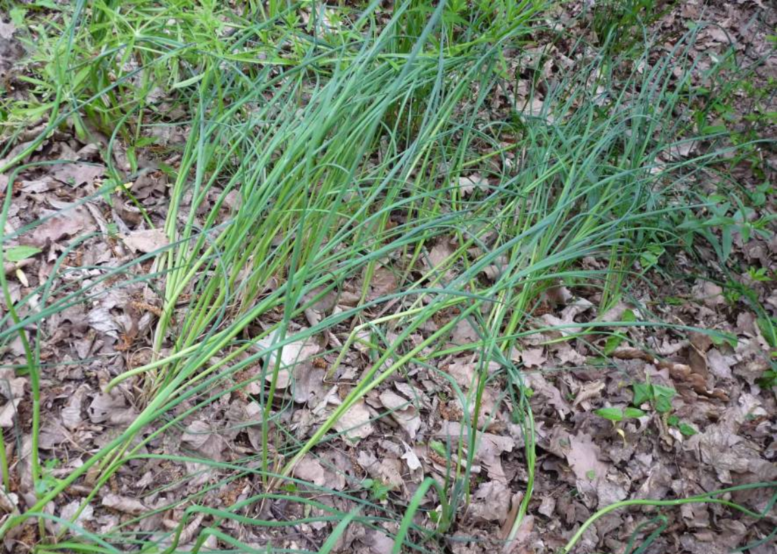
česnek zelinný ( Allium oleraceum ) v habrovém lese