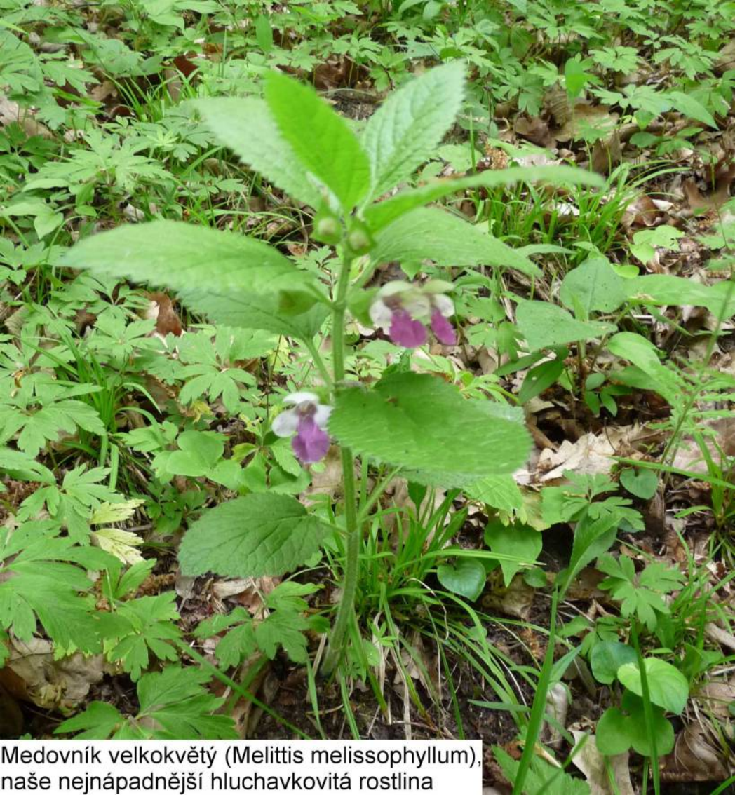
Medovník velkokvětý ( Melittis melissophyllum ), naše nejnápadnější hluchavkovitá rostlina