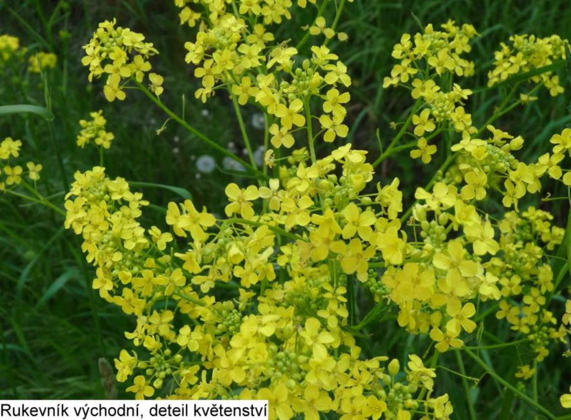
Rukeník východní, detail květenství