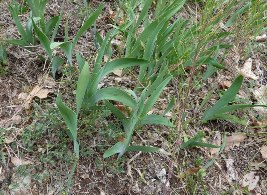
kosatec nízký ( Iris pumila ) zatím nekvetl