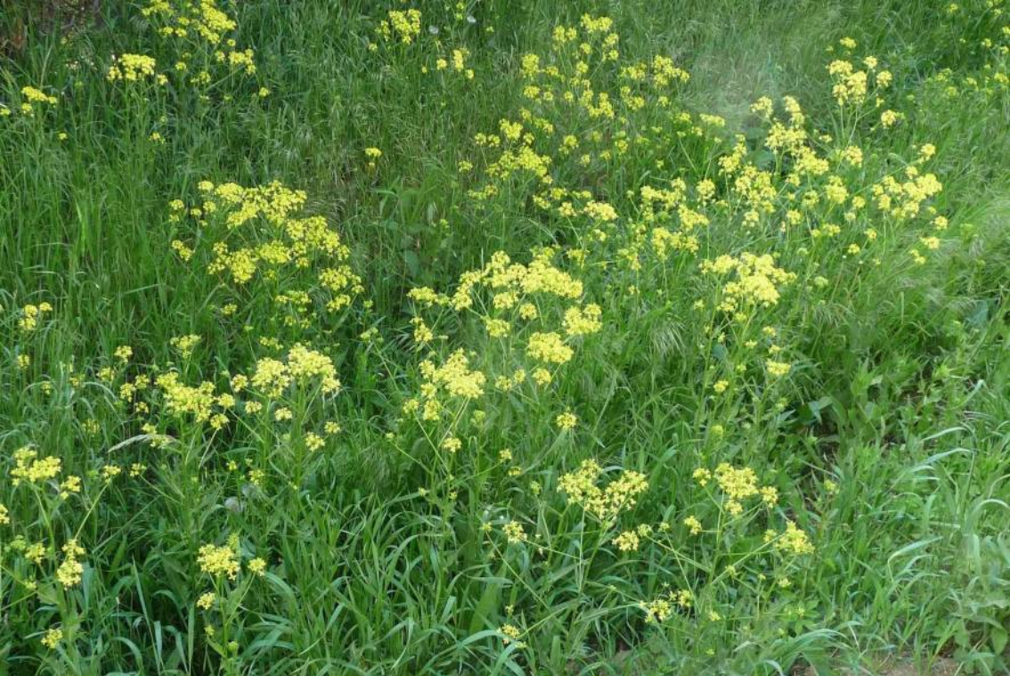
Rukevník východní ( Bunias orientalis ), brukvovitá rostlina, planě rostoucí u cest