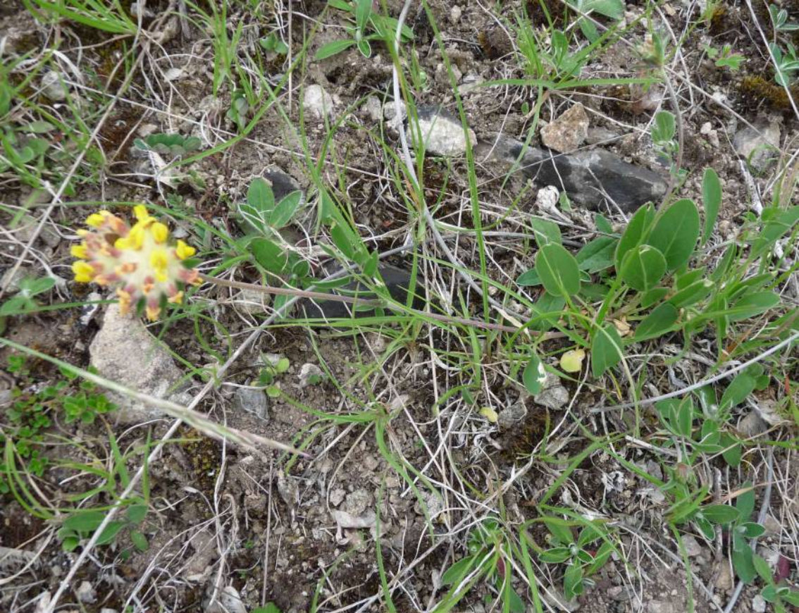
Úročník bolhoj ( Anthyllis vulneraria )