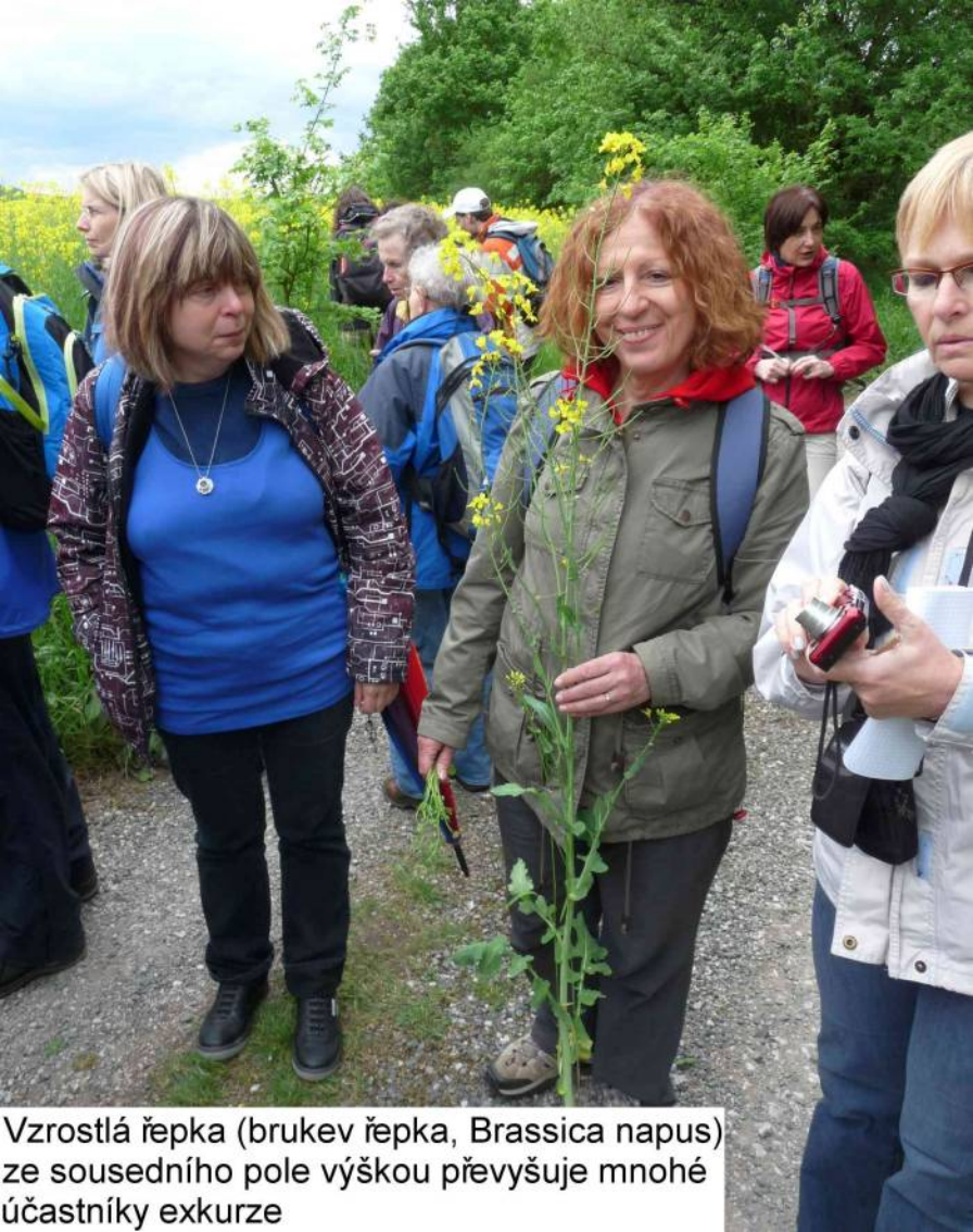
Vzrostlá řepka (brukev řepka, Brassica napus ) ze sousedního pole výškou převyšuje mnohé účastníky exkurze