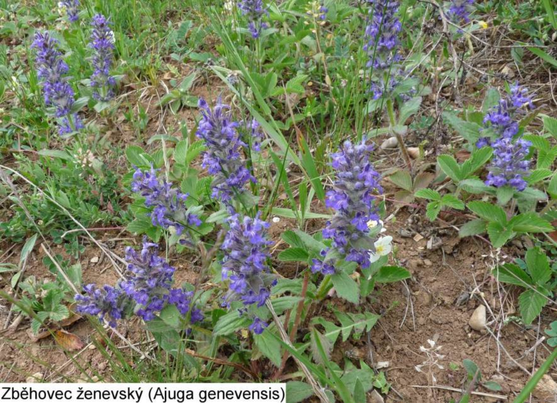
Zběhovec ženevský ( Ajuga genevensis )