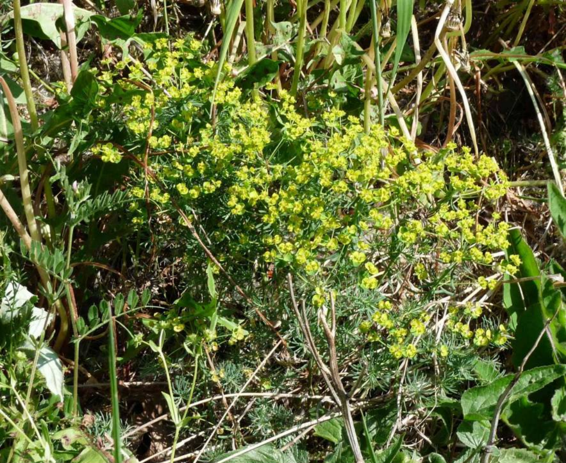
Pryšec chvojka ( Euphorbia cyparissias ), jedovatá rostlina z čeledi pryšcovitých