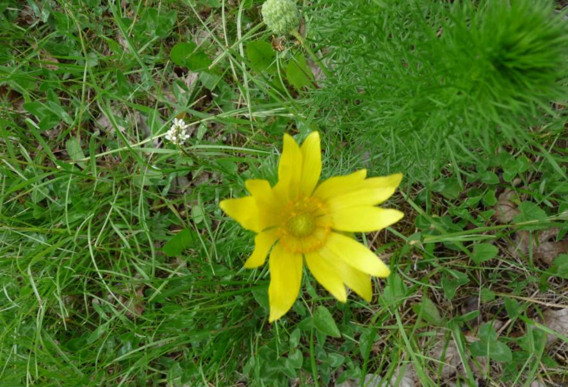
Hlaváček jarní ( Adonis vernalis ), jeden z pozdních květů, většina rostlin již byla odkvetlá