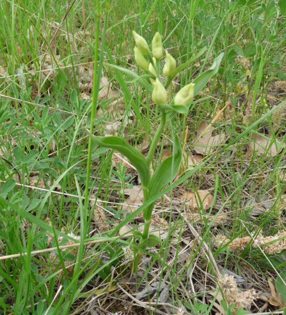
Okrotice bílá ( Cephalanthera damasonium ) roste v řídkých lesích. Těsně před rozkvětem.