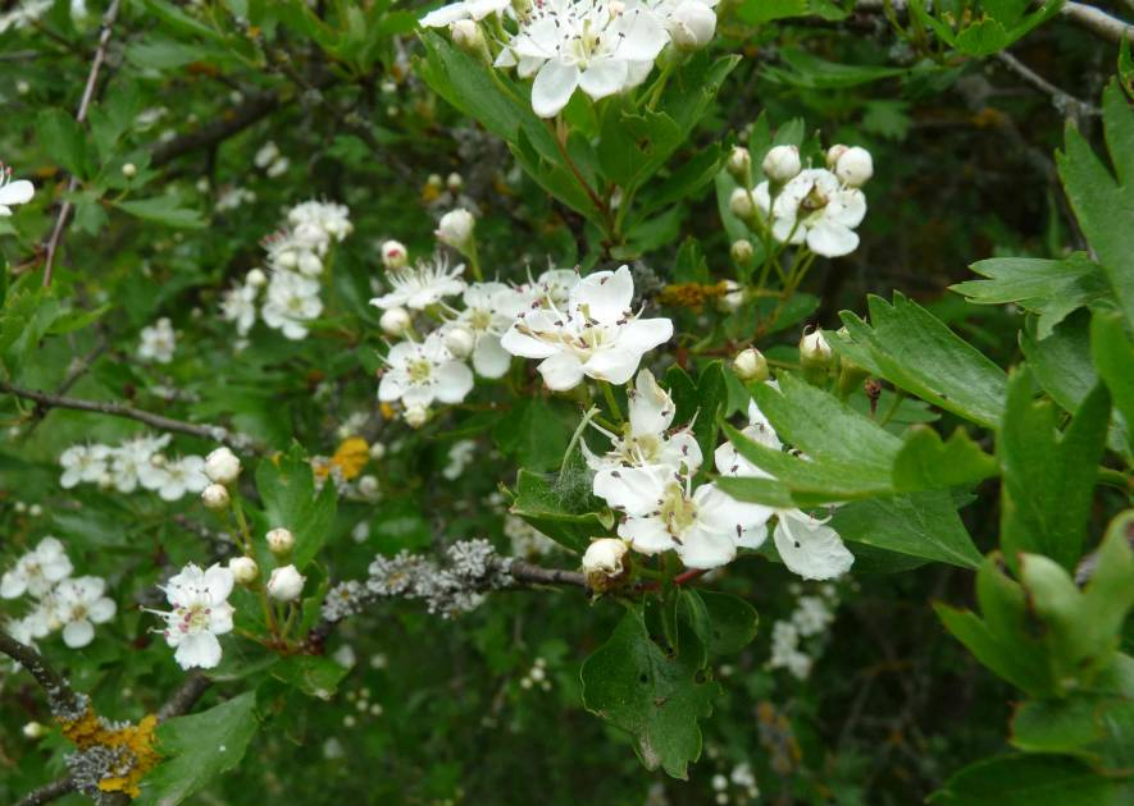
Hloh jednosemenný ( Crataegus monogyna )