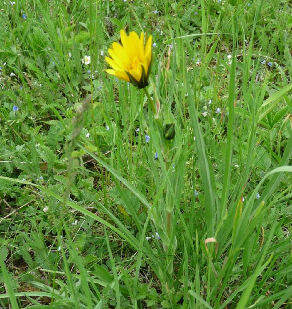
Kozí brada východní ( Tragopogon orientalis ), luční rostlina.