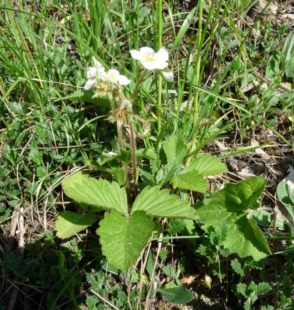
Jahodník truskavec ( Fragaria moschata ) má z planých druhů největší plody