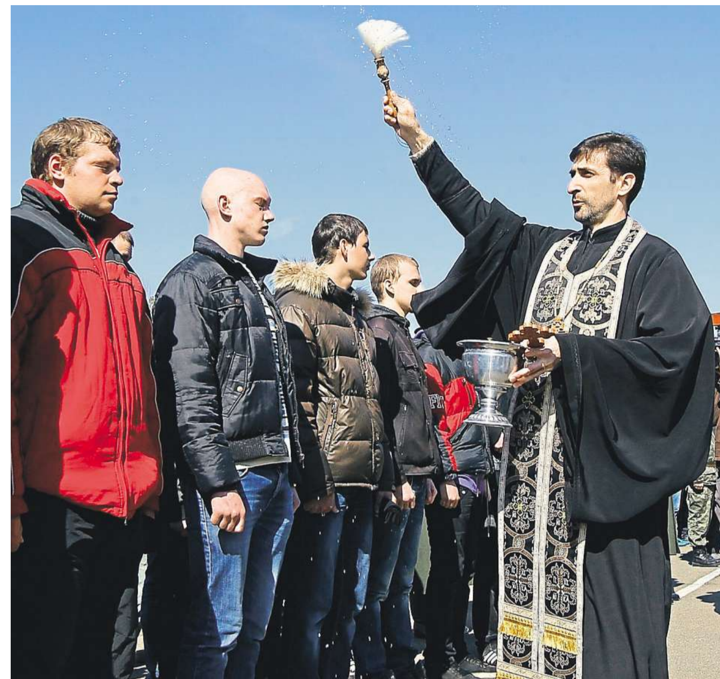
Požehnání odvedencům. Ukrajinská armáda povolává záložníky. Dopisy poslala i mužům, kteří žijí v Česku.