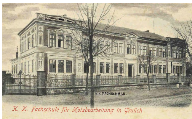
Králíky – řezbářská škola 1873–1945.