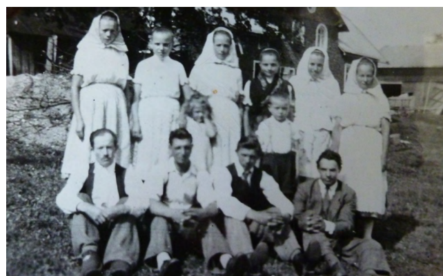
Slovenští osídlenci ze Sedmíhradska v Rumunsku přesídlení na Králicko po roce 1945. Fotografie z padesátých let 20. století.