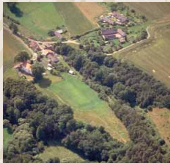
Obr. 6 (088): Hradiště, katastrální obec Nesperská Lhota, Středočeský kraj. Malé jednodílné hradiště s gotickým kostelem Nejsvětější Trojice nad soutokem Blanice a bezejmenného potoka poblíž Vlašimi. Osídlení doložené povrchovými sběry jej datuje do 11.–13. století. Letecký průzkum odhalil zhruba v polovině vzdálenosti mezi kostelem a východním cípem hradiště mohutný, dnes zasypaný příkop, který je na snímku dobře patrný svým tmavším zbarvením.