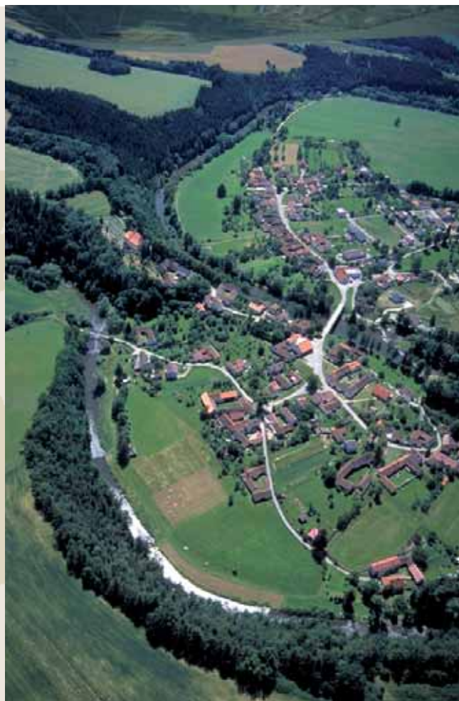
Obr. 15 (097): Doudleby, Jihočeský kraj. Další z údajných kmenových center je uváděno v Kosmově kronice v souvislosti s popisem hranic slavníkovské domény. Později bylo přeměněno na přemyslovské správní centrum zdejšího kraje.

z těchto hradů stával kostel jako výraz oficiálního příklonu vládnoucího rodu ke křesťanství.