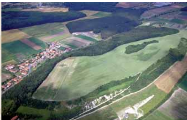
Obr. 2 (084): Přerov nad Labem, Středočeský kraj. Mohutný terénní blok Přerovská hůra, převyšující okolní polabskou nížinu zhruba o 50 metrů. V devadesátých letech odhalil letecký průzkum existenci dvou paralelních příkopů, na snímku dobře patrných, které člení vrcholovou partii plošiny kopce na akropoli a předhradí. Místo bylo opakovaně osídleno v pravěku (doba bronzová a železná) a v raném středověku.