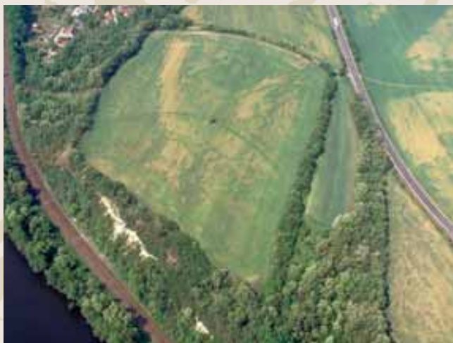
◀ Obr. 7 (089): Vepřek, Středočeský kraj. Další z míst, na němž byl v nedávné době prostřednictvím letecké prospekce prováděné Archeologickým ústavem AV ČR objeven dokonce dvojnásobný systém příkopů, táhnoucích se napříč mohutným terénním blokem nad ohybem Vltavy mezi Kralupy a Mělníkem. Kromě doloženého pravěkého osídlení zde při nedávném záchranném výzkumu došlo k nálezům raně středověké zásobní jámy (obilnice), ale stáří příkopů se jednoznačně určit nepodařilo.