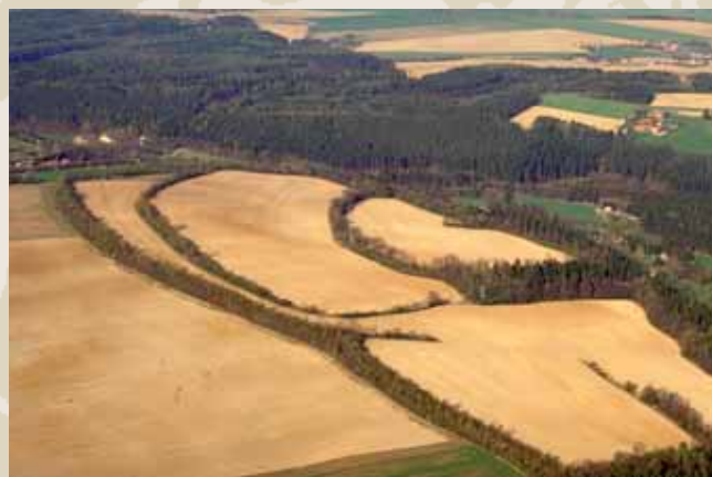
Obr. 4 (086): Hryzely, Středočeský kraj. Další z rozsáhlých hradišť (téměř 27 hektarů) na Kolínsku, jehož celková dispozice vykazuje zřetelné shody se Starou Kouřimí. Drobné sondáže ukazují, že zdejší osídlení pochází převážně z období středohradištního (9. století).