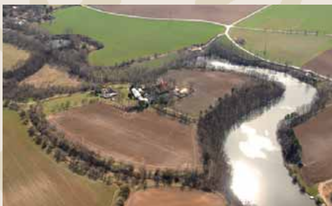
Obr. 11 (093): Chloumek u Mladé Boleslavi, Středočeský kraj. Hradiště v poloze Švédské šance s mohutným valem bylo osídleno v pravěku a pak v 9.–10. století. Jeho zánik býval spojován se zprávou písemných pramenů o podmanění místního vládce Boleslavem I. v roce 936.

tém století (Boleslav I. a Boleslav II.), a k vrcholu dovedeného ve století 11. za panování Břetislava I. vytvořením tak zvané hradské soustavy.