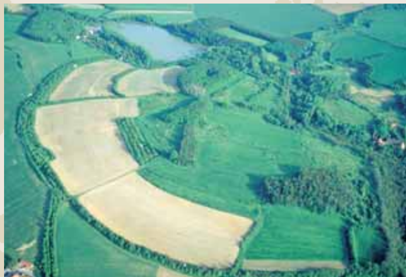
Obr. 3 (085): Stará Kouřim, Středočeský kraj. Jedno z nejvýznamnějších, největších (44 hektarů) a nejlépe archeologicky poznanych raně středověkých hradišť. Letecký snímek ukazuje stále ještě dobře patrný průběh valů prvního a druhého předhradí a vnitřního areálu. Hradiště je uváděno v Kristiánově václavské legendě. Je pravděpodobné, že zaniklo kolem poloviny 10. století, v době násilného rozšiřování přemyslovského území mimo původní středočeskou doménu.