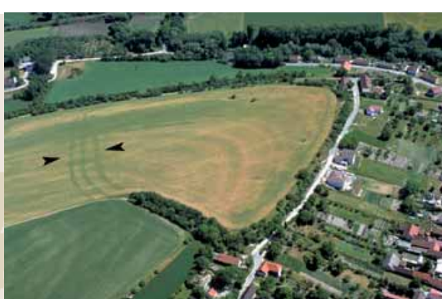
Obr. 9 (091): Přívory, Středočeský kraj. Trojitý příkop identifikovaný díky porostovým příznakům na jihovýchodním konci Turbovického vrchu na Mělnicku. Teprve letecký průzkum přinesl bezpečný doklad o tom, že toto místo bylo ohrazeno, a navíc způsobem pro raný středověk velmi neobvyklým. Výsledky sondáže z roku 2000 datují systém paralelních příkopů do raného středověku, respektive do 10. století.

ale několik desítek nepochází z raného středověku, nýbrž ze starších dob (pravěk). V posledním katalogu českých slovanských hradišť, který pochází z pera profesionálního badatele, se uvádí celkem 130 těchto ohrazených míst. Opominout nelze ani populární práci Staročeské hrady (jejíž titul je mimochodem totožný s názvem první historizující reflexe tehdejšího archeologického pozná-