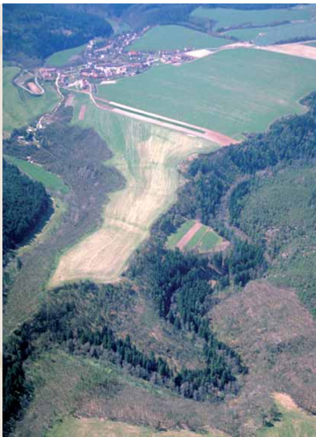
Obr. 12 (094): Dolní Hradiště, Plzeňský kraj. Jazykovitě vyběhající ostrožna nad soutokem Sřetřelky a Karlovického potoka. Šipky ukazují na dnes již málo zřetelné pozůstatky valů a příkopů. Úplně nahoře je na porostu vidět tenká linie donedávna neznámého příkopu, který dokládá, že hradiště bylo čtyřdílné. Raně středověké osídlení této polohy je datováno do střední doby hradištní (snad přelom 9. a 10. století).