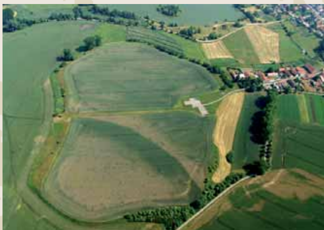
Obr. 5 (087): Libice nad Cidlinou, Středočeský kraj. Jedno z našich nejznámějších hradišť, v němž roku 995 došlo k vyvraždění Slavníkovců. Jeho rozsáhlý výzkum vedený po válce Národním muzeem odhalil existenci kostela a knížecího paláce na akropoli. Na předhradí (dnešní intravilán obce) provádí od sedmdesátých let intenzivní předstihové a záchranné akce Archeologický ústav AV ČR.