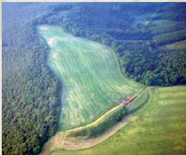
Obr. 10 (092): Královice, městský obvod Praha 10. Dvojdílné hradiště „U Sv. Markěty“ (rozloha 7,5 ha), umístěné na pravém břehu Rokytky, dodnes uchvacuje mohutností svých hradeb. Velmi dobře je zachován zejména vnější příkop a val (délka asi 340 m, šířka 20 m, výška až 7 m). Život na tomto hradišti se podle dosavadních znalostí klade do mladší doby hradištní (11.–12. století).

ní hradišť od J. Braniše z roku 1909), do níž autoři zahrnuli na 220 objektů.