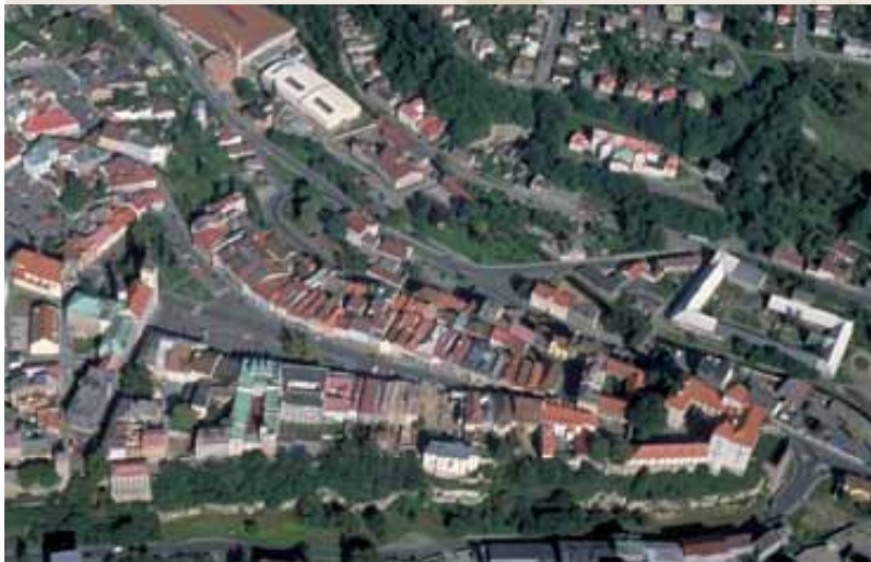
Obr. 8 (090): Mladá Boleslav, Středočeský kraj. Jeden z významných přemyslovských hradů je typickým příkladem správního sídla, v jehož areálu byl později postaven kamenný hrad a další zástavba získala podobu vyspělého vrcholně středověkého městského celku.