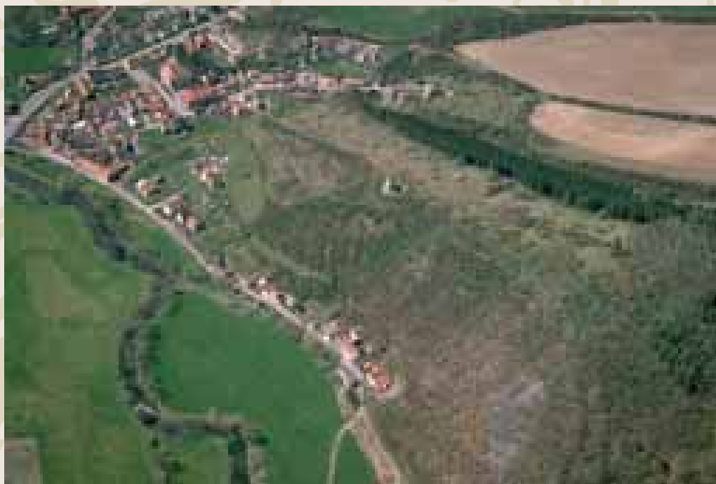
Obr. 13 (095): Starý Plzenec, Plzeňský kraj. Někdejší správní centrum západních Čech z dob Přemyslovců (11.–13. stol.) založené na důležité dálkové trase. Kromě dosud stojící rotundy sv. Petra na západním předhradí zde stávaly ještě kostely sv. Vavřince (akropole) a sv. Kříže (východní předhradí). Místo bylo opakovaně archeologicky zkoumáno.

etapa v genezi opevněných sídel nastává na konci 9. století. V souvislosti s nástupem Přemyslovců, kteří v této době zahájili proces budování prvního „státečku“ na území jimi stále zřetelněji ovládané středočeské domény, dochází k postupnému zániku starších „kmenových“ hradišť a k zakládání přemyslovských správních center – hradů, označovaných v písemných pramenech termíny jako civitas ( metropolis ), urbs , oppidum , castrum . Tyto objekty jsou méně rozsáhlé – většinou zaujímají plochu 5–10 hektarů – a jsou opevňovány hradbami konstruovanými pomocí dřevěných komor vyplněných hlínou, které nasedají na mohutnou čelní kamennou plentu. Vzhledem k výskytu tohoto druhu opevnění ve spojení s vládnoucí dynastií se k jejímu označení používá termín přemyslovská hradba. Na každém