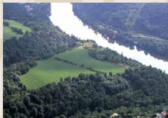
Obr. 1 (083): Praha – Bohnice (Zámka), městský obvod Praha 8. Jednodílné ostrožné hradiště umístěné v kaňonovitém údolí Vltavy severně od pražské kotliny. Patří do skupiny hradišť, která na území Velké Prahy předcházela hradům přemyslovského založení (Pražský hrad, Vyšehrad). Výzkumy na jeho ploše odhalily starší pravěké osídlení a datovaly osídlení z raněho středověku do 8.–9. století.